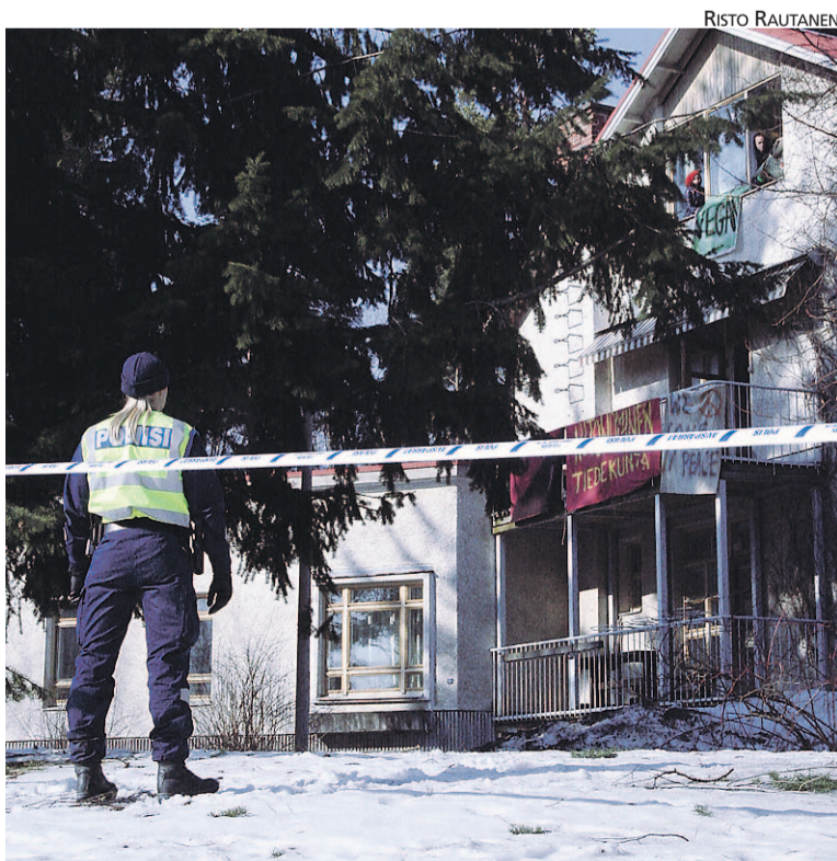
Poliisi ympäröi vallatun talon nauhoilla, joiden sisäpuolella seisoivat poliiseja ketjussa ympäri tonttia.