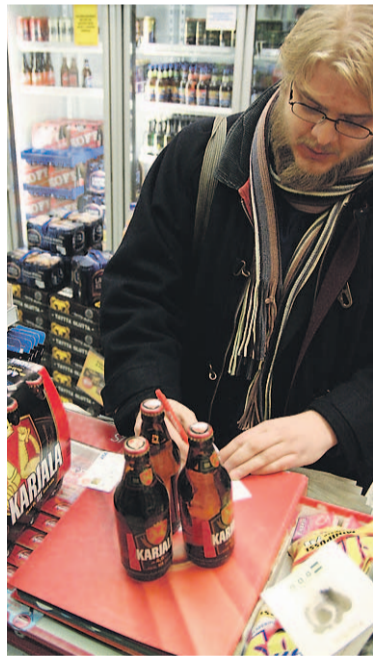
Irtopullojen puuttuessa myyjä suostui repimään sikspäkin.

KYMPISSÄ MENIN tiskille sikspäkin kanssa ja kysyin, eikö minulle tulisi halvemmaksi ostaa nämä kuusi pulloa yksittäin. Tulisi kuulemma. Sanoin, ettei yksittäisiä pulloja ollut, joten voimmeko siten lyödä nämä kuusi kassaan yksittäin. Emmepä voineet, mutta sen sijaan toinen myyjä kipaisikin takahuoneesta kuusi irtopulloa. Loppu hyvin kaikki hyvin.