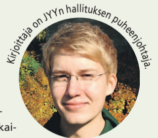
Kirjoittaja on JYYn hallituksen puheenjohtaja.

Käyttämällä väärin tätä tasa-arvoista koulutusmahdollisuutta, annamme myös aseita lukukausimaksuja ja muita opiskelijoita rankaisevia menetelmiä kannattaville.