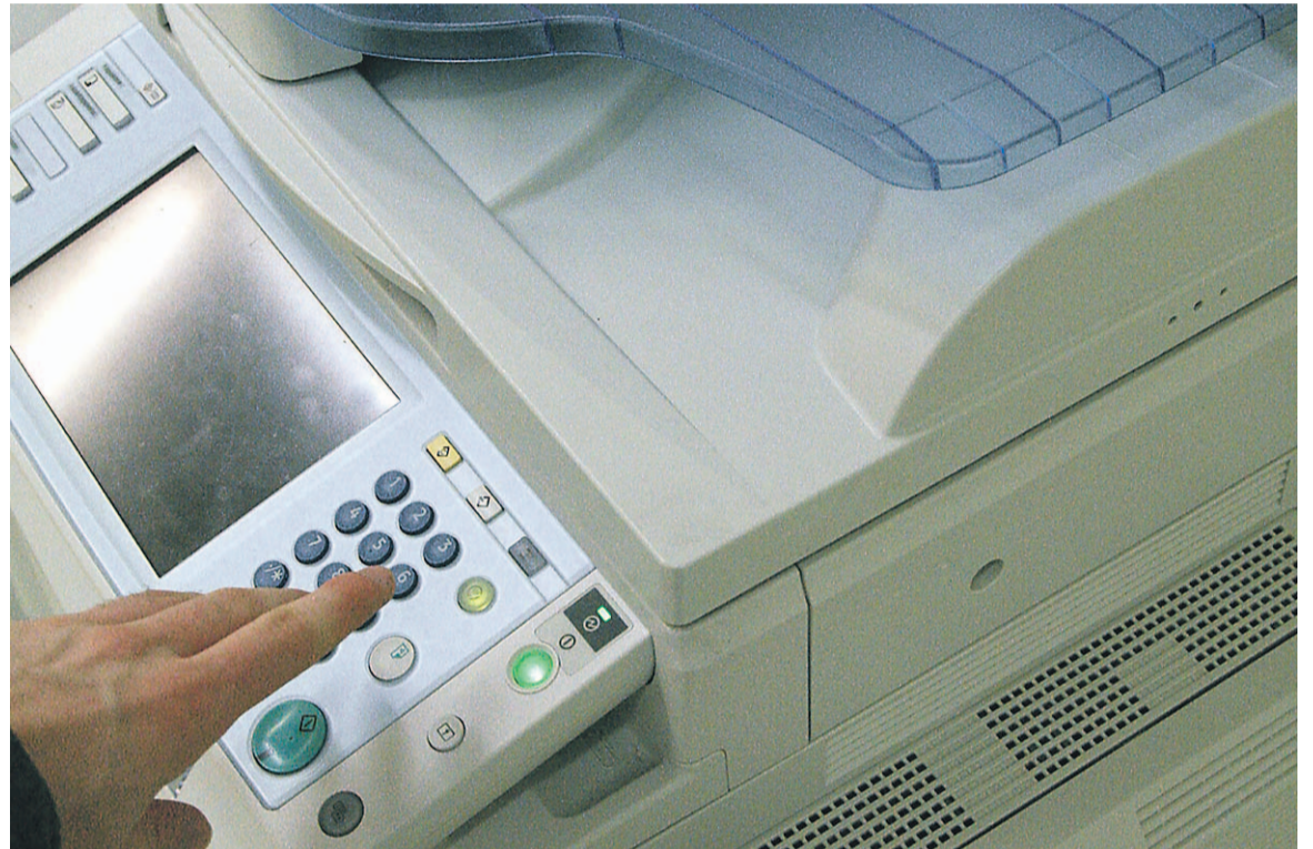
Kaikki uusien monitoimikoneiden käyttöön liittyvä tieto ei ole vielä kulkeutunut jokaiselle opiskelijalle.