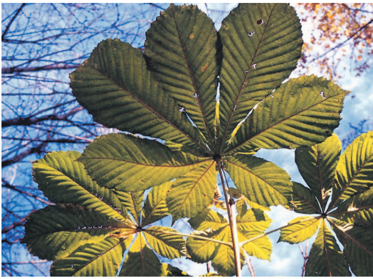
Varjojrttiä kasvaa Opinportin vieressä olevassa liikenteenjakajassa.