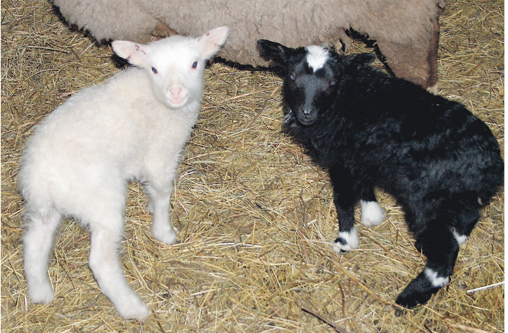
Hartolalaisen Harjun luomutilan karitsat näyttävät hellyttäviltä, mutta aiheuttavat synnyttyään paljon paperitöitä tilan omistajille.