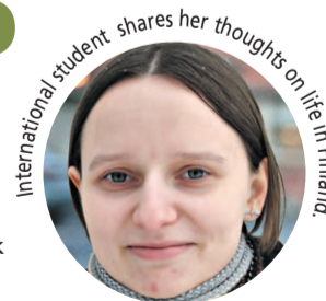
International student shares her thoughts on life in Finland.