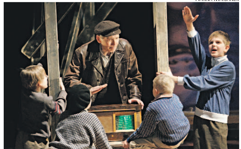
Mihin sateenkaari päätty -näytelmän lapsinäyttelijät eivät unohda vuorosanoja.