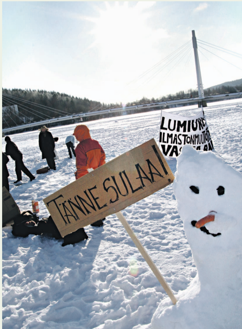
Lumiukot ja Maan ystävät muistuttivat ilmastomuutoksesta Mattilanniemen rannassa viime viikon tiistaina.