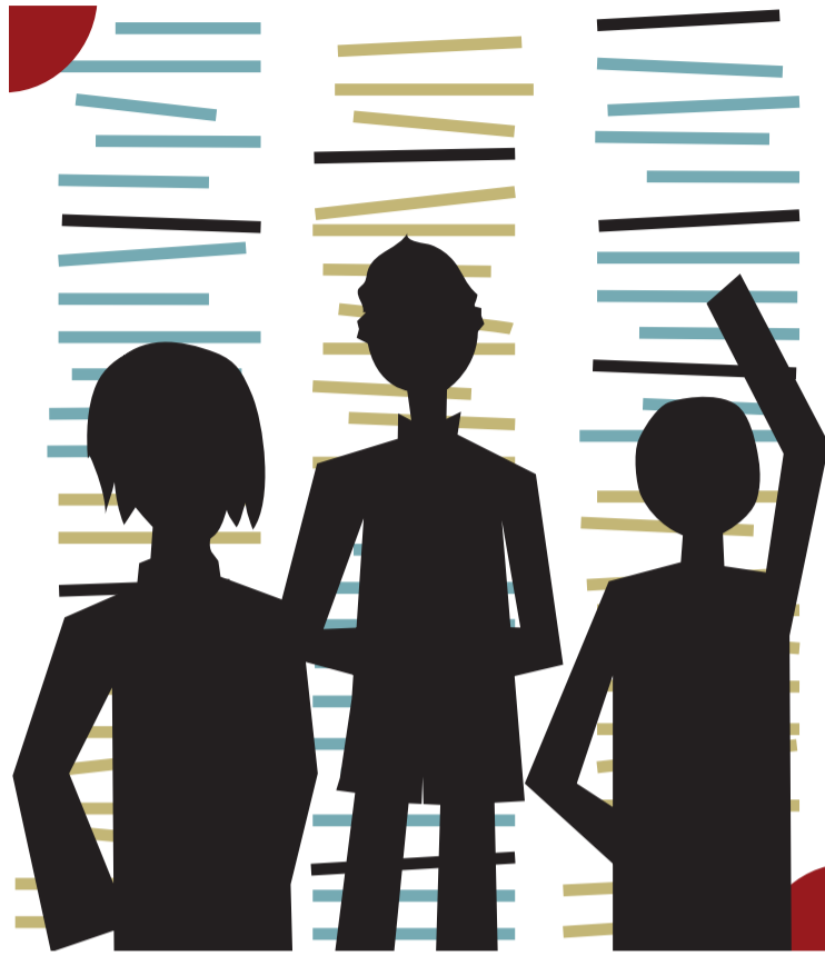
Lehden toimittajakunnan jäsenet pysyvät piilossa.

TOISTAISEKSI LEHDEN varainhankinta on tapahtunut esimerkiksi oheistuotteiden avulla. Paitoja on markkinoilla, mutta Elokuu ei ole nähnyt vielä