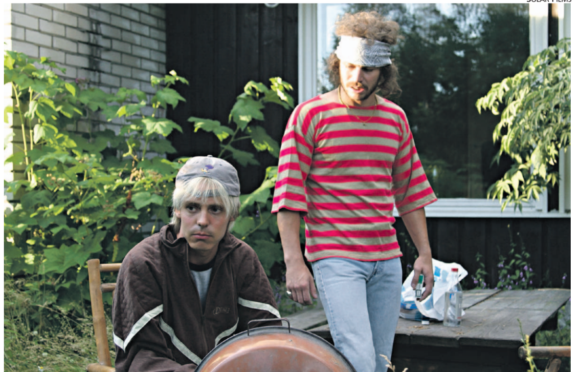
Matti -elokuvaa kuvattiin Jyväskylän maisemissa.