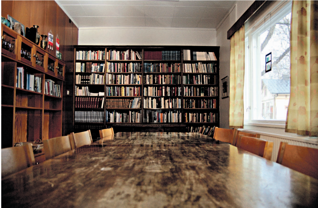
Kirjailijatalo on ollut pyhitettynä kirjallisuudelle vuodesta 1989 lähtien.

Raatikellari ehti toimia ydinkeskustassa samoissa tiloissa vuodesta 1971 lähtien.