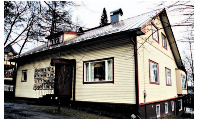
Talo sai satavuotisjuhlansa kunniaksi kasvojenkohotuksen.