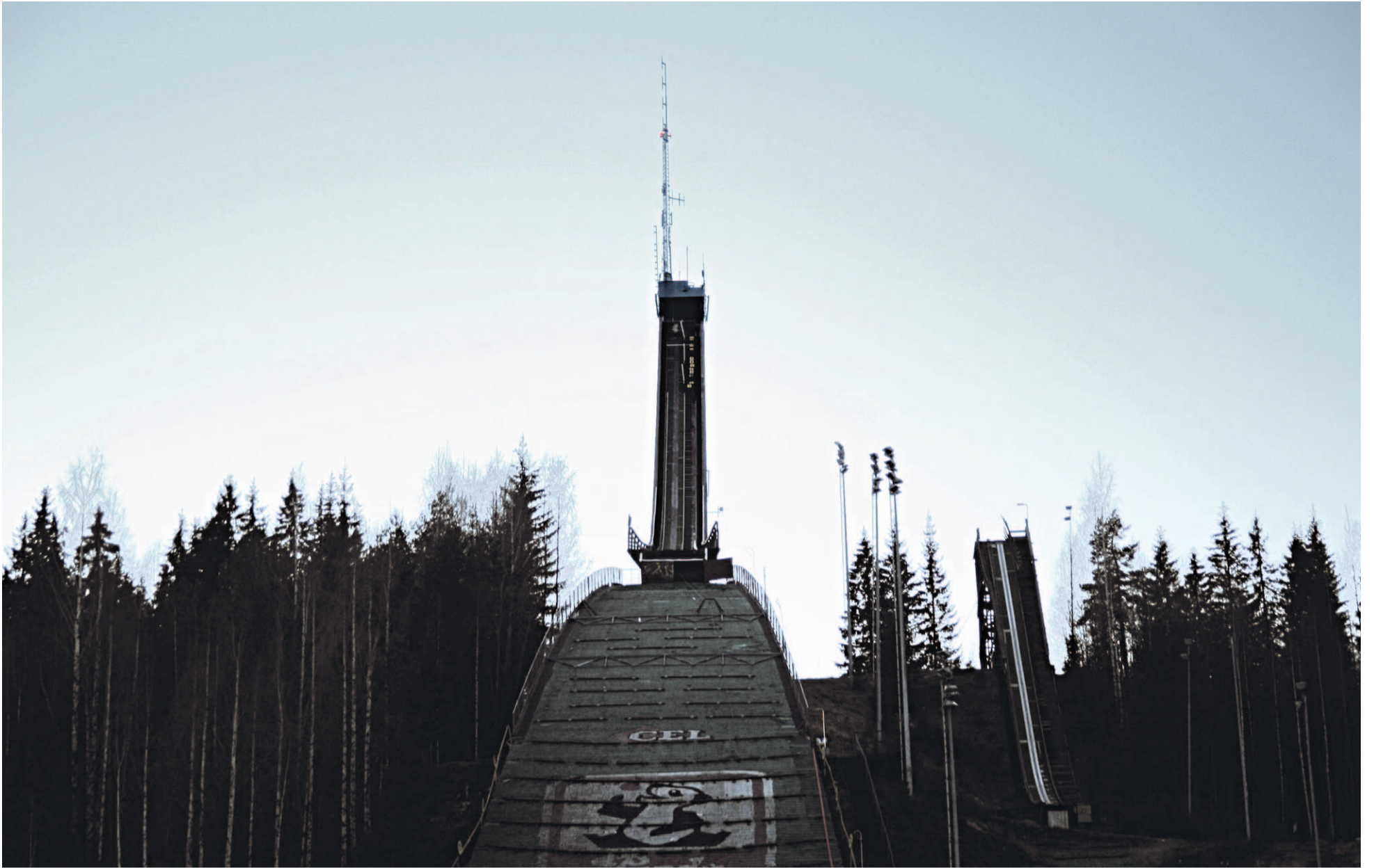
Laajavuori on ollut elokuvateollisuuden käytössä ainakin kaksi kertaa.