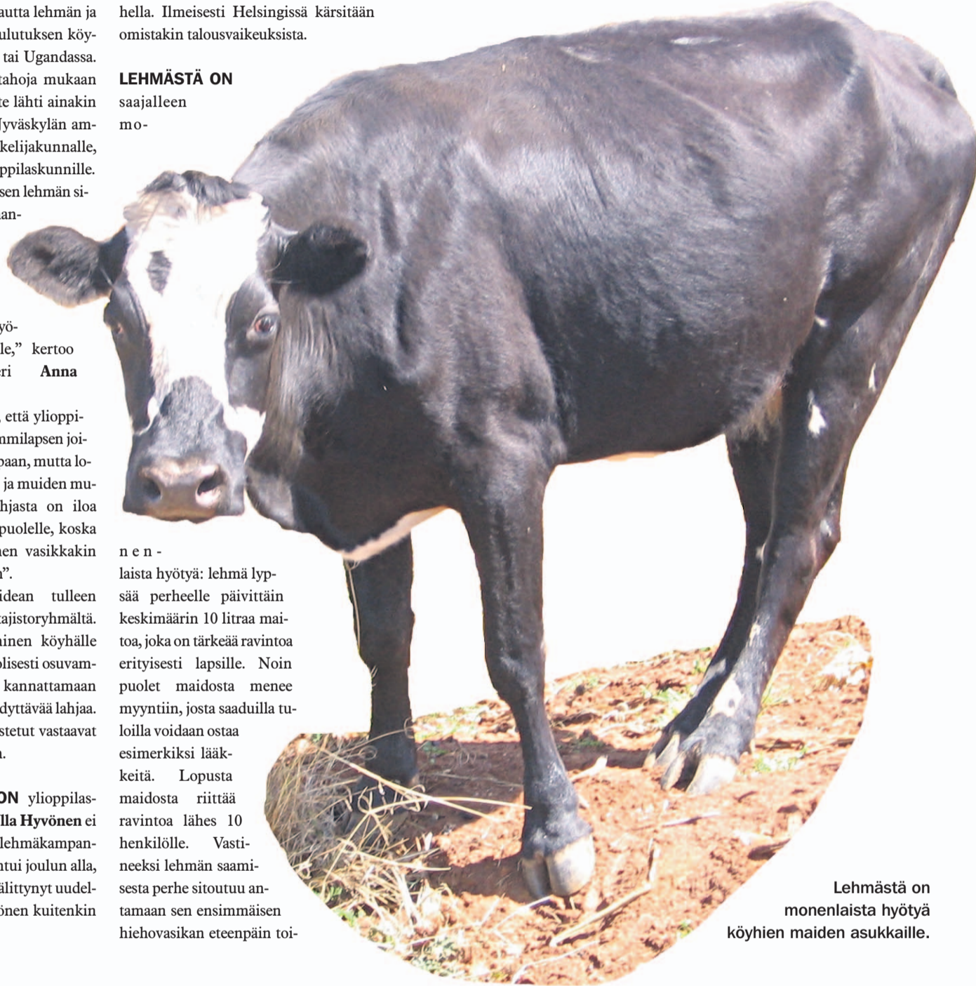
Lehmästä on monenlaista hyötyä köyhien maiden asukkaille.