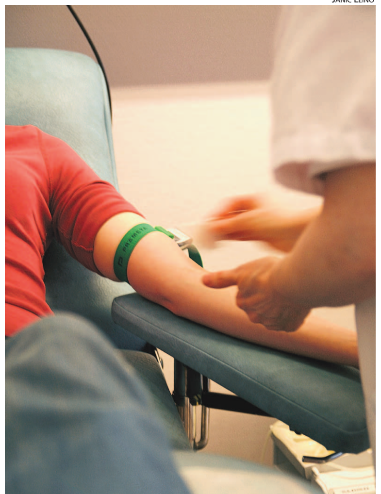
Verta tarvitaan päivittäin noin tuhat pussillista.

Jyväskylän veripalvelu Väinönkatu 40 ma, ti, to 12–18, ke, pe 10–15 www.veripalvelu.fi