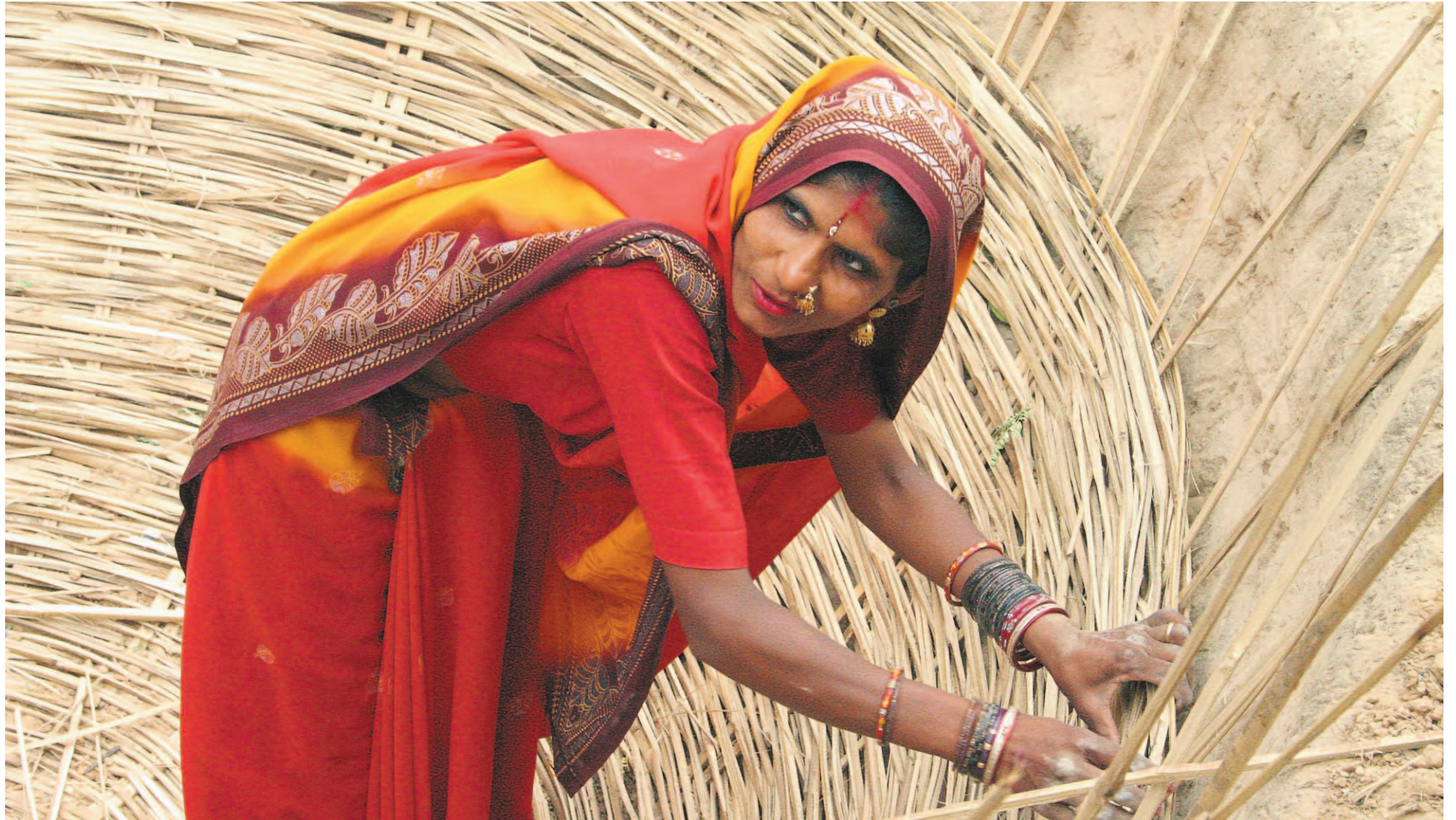
Bambunpunoja valmistaa maahan kaivetussa kuopassa bambukehikkoa Grameen Bandhu -biokaasureaktoria varten.

Intiassa JYYn avulla neljä vuotta sitten käynnistetty malliekokylähanke kantaa hedelmää.