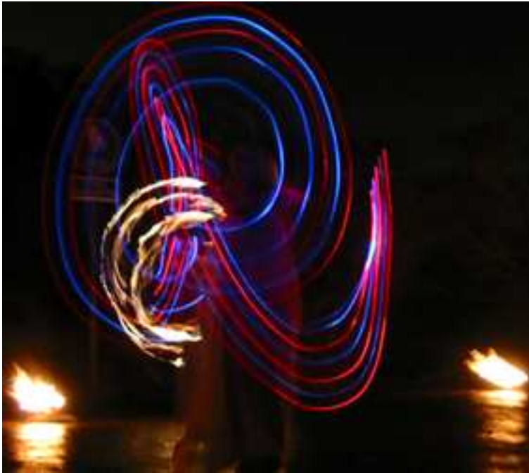
Kuva 8. Uv- ja tulipyöritystä. Tuliryhmä Flamma.