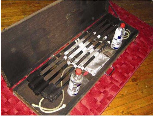
Kuva 7. Pitkiä keppejä sekä lamppuöljyä.

H1: Must se jakaantuu sen mukaan, et joku tekee jotain jollain keikalla, kun sillä tarvii tehdä sellasta.