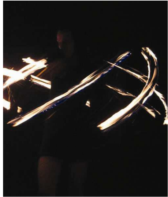
Kuva 2 ja 3. Tulivanteen pyörittäjä Tuliryhmä Kipunasta esiintymässä Oulun taiteiden yössä elokuussa 2008.