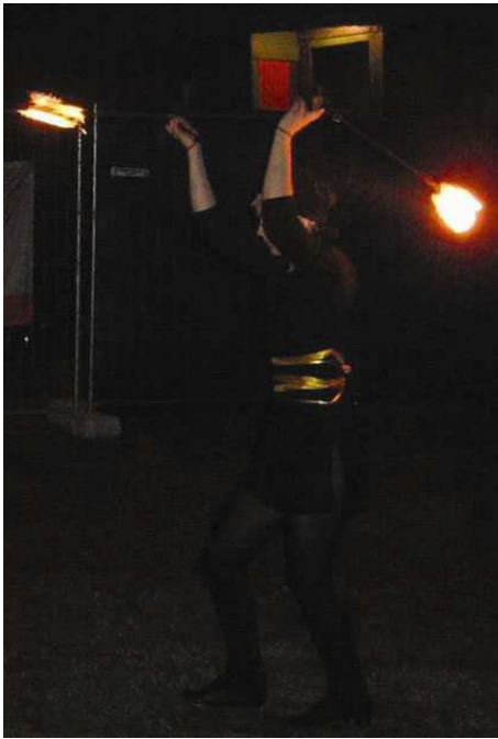
Kuva 1. Tulipoiden pyörittäjä. Tuliryhmä Kipuna.

Työni järjestys on seuraavanlainen: Luvussa kaksi tuon ilmi valitsemiani tutkimusmenetelmiä ja aineistoani. Luvussa kolme esittelen tuliryhmiä ja informantteja. Luvussa neljä käyn läpi työni kannalta keskeisiä käsitteitä sekä teoreettista viitekehystäni. Luvussa viisi luon puolestani lyhyen katsauksen siihen, millä muulla tavoin ihminen on hyödyntänyt tulella tekemisen taitoaan sekä tarkastelen tulitaiteilun kehitystä lajina. Luvussa kuusi esittelen lajin ominaispiirteitä, ja luvussa seitsemän tarkastelen kolmea tuliesitystä tarkemmin. Luvussa kahdeksan analysoin tulitaiteilun erilaisia tyylejä ja alalajeja sekä niiden suhdetta muihin ilmiöihin. Luvussa yhdeksän pohdin tulitaiteilijoiden tuleen liittämiä merkityksiä ja luku kymmenen kokoaa tutkimustulokset ja toimii työn päätöslukuna.