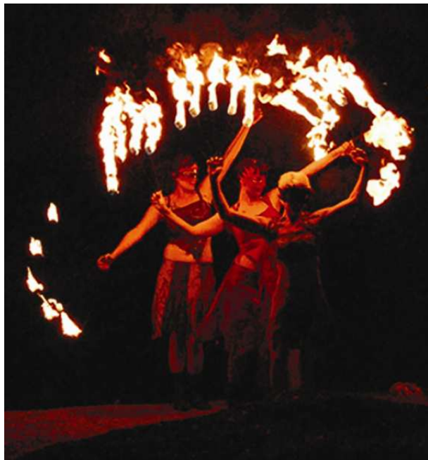
Kuva 5. Tuliryhmä Flamma. Narrien Uni (2007).

H1: Ei me olla synnytty mistään sirkuksen ja uuden sirkuksen perinteestä, ei me olla synnytty mistään katuteatterista, me ollaan enemmän kuitenkin tultu tuolt bileistä ja siit, mitä jengi puuhaa talvella etelän rannoilla, kun niillä ei oo muuta tekemistä... siihen me kuulutaan.