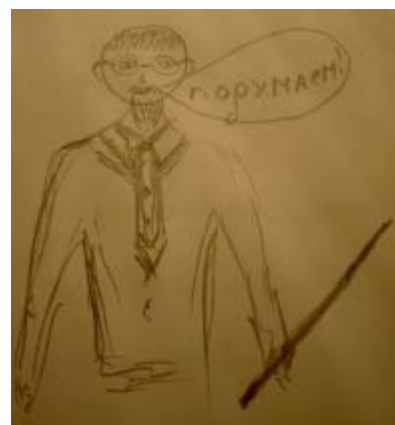
ЯР, девушка, 16.