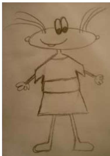
Коми, девушка, 17.