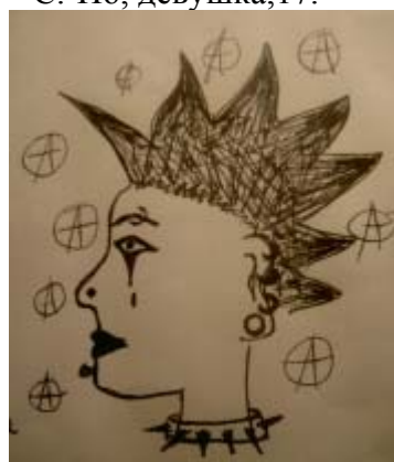
ЯР, девушка, 16.