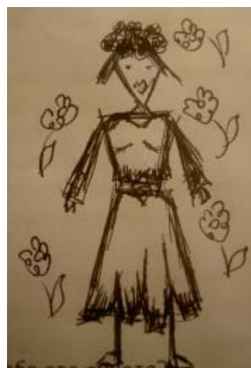
ЯР, девушка, 16.