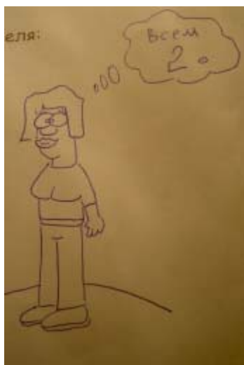
ЯР, юноша, 16.