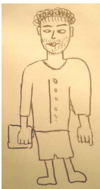
ЯР, юноша, 16. Коми, юноша, 17.