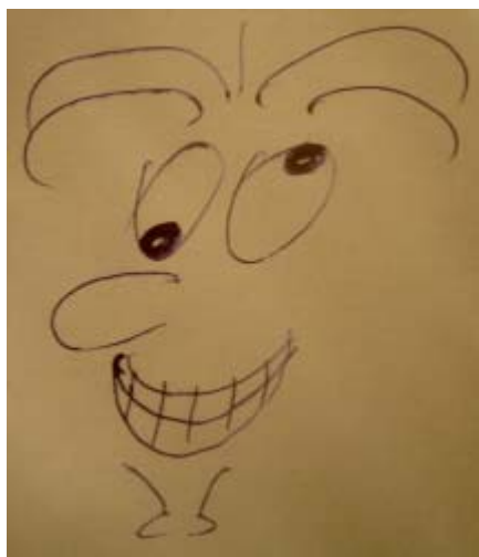
Коми, юноша, 17.