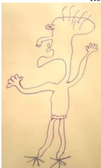
Коми, юноша, 17.