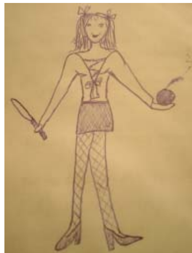
С.-Пб, девушка, 17.