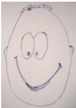
Коми, девушка, 17.