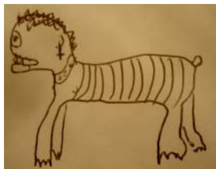
С.-Пб, юноша, 16