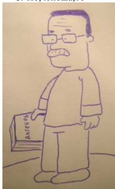
ЯР, юноша, 16.