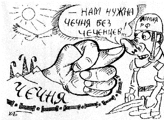
Комикс <URL: http://www.kavkaz.org/ncsipt/fenomen/chast14.htm >.

Kavkaz-Center rakentaa argumentaationsa myös konfliktin syntyä koskeviin kuvauksiin. Pääargumentiksi nousee, että Tshetsheniassa on käynnissä kansanmurha ( геноцид, genocide ), jonka syyt ovat poliittiset. Armeijan johto etsii revanssia ensimmäisen sodan häviölle. Toisaalta Putin ja hänen lähipiirinsä haluavat lujittaa hallintaansa Kaukasiassa geopoliittisten syiden takia. Unohtaa ei myöskään voi Putinin halua tehdä itsensä suosituksi presidenttinä. Kansanmurha-teemalla Kavkaz-Center tarjoaa selitykseksi sodalle tshetsheeneistä riippumattomia seikkoja. Tshetsheetit ovat sivujen viestin mukaan viattomia uhreja, jotka ovat joutuneet Venäjän politiikan pelinappuloiksi. Venäjä haluaa pitää Tshetshenian itsellään, muttei siellä asuvia tshetsheenejä: