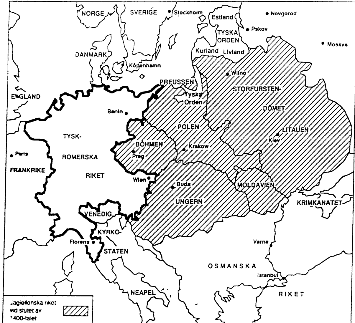
Kartta 1. Jagellonien valtakunta ja saksalaisroomalainen valtakunta 1400-luvulla (Gerner 1992, 124)