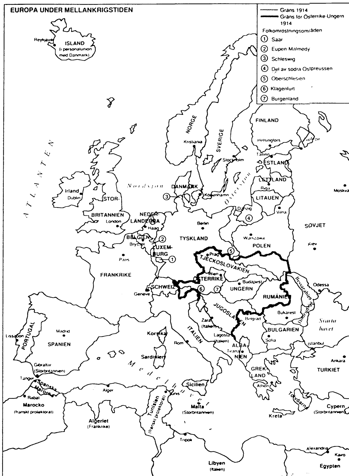
Kartta 2. Keski-Eurooppa maailmansotien välillä 1918–1939 (Gerner 1992, 62)