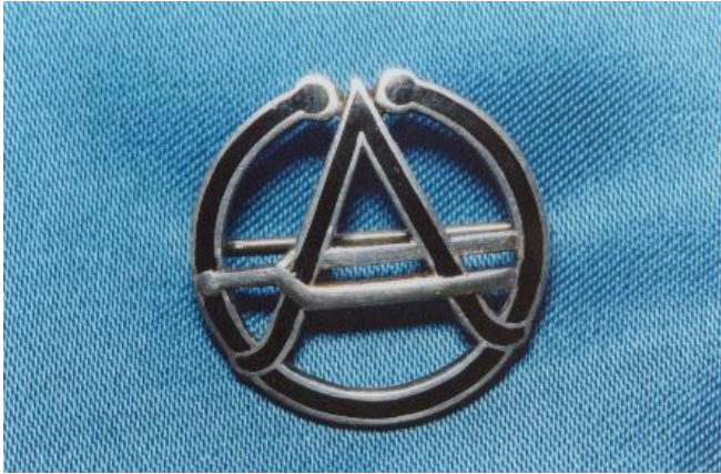
Kuva 2. Äänekosken Naiskuoron rintamerkki