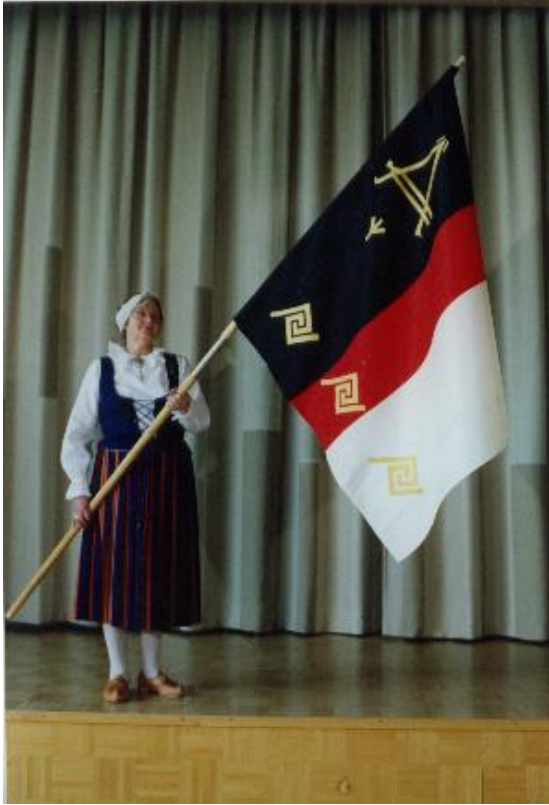
Kuva 3. Äänekosken Naiskuoron lippu

Kuoron lippu valmistui kesällä 1958, mutta se otettiin käyttöön vasta seuraavana keväänä. Kuoron toimintakertomuksessa (1958) mainitaan, että “ Koska kuoron oma lippu saatiin vihdoin lunastaa valmiina --- “ ja edelleen: “Syksyn lyhyt harjoituskausi ja lukuisat yhteensattumat estivät kuitenkin suunnitellun konsertin pidon ja se siirrettiin seuraavan vuoden alkupuolelle.“ Kuoron lippuun valitut värit ja kuviot viestittävät Äänekosken Naiskuoron arvojen lähtökohdista: kotiseutu, isänmaa, oma suomalainen kulttuuriperintö ja sen vaaliminen.