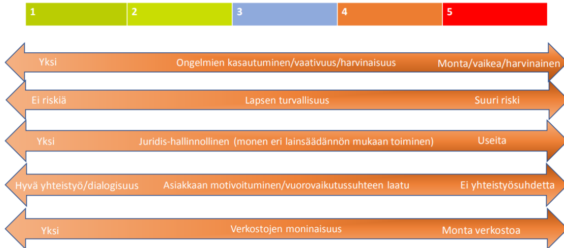
Kuva 2 OT-seula; Petrelius, Vartio ja Yliruka 2018