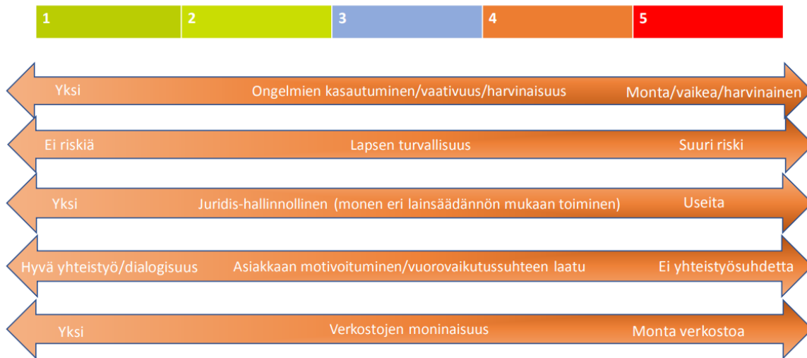
Kuvio 3 OT-seula; Petrelius, Vartio ja Yliruka 2018

Ulottuvuuksille 1) "ongelmien kasautuminen/vaativuus/harvinaisuus", 2) "lapsen turvallisuuden kohdistuvan riskin suuruus", 3) "juridis-hallinnollinen ulottuvuus", 4) "asiakkaan motivoituminen/vuorovaikutussuhteen laatu" ja 5) "yhteistyöverkostojen moninaisuus" jäsenyntyneitä vaativuuden kuvauksia tarkastelin sisällönanalyysin teemojen perusteella. Teemojen esiintyvyyksien laskennallinen vertailu karsi aineistoa siten, että ensimmäisessä vaiheessa rajasin yhteenvedoista pois ne, joissa teemojen esiintyvyys jäi suhteessa huomattavasti alhaisemmaksi. Ajattelin näissä olevan kyse lastensuojelun sijaishuollon kontekstissa niin sanotusta tyypillisestä vaativuudesta. Jäljelle jäivät kymmenen 18:sta yhteenvedosta. Näistä karsin seuraavaksi kaksi, joissa oli havaittavissa jokin merkityksellinen vaativuutta vähentävä voimavara- tai suojatekijä. Toisessa tällainen poikkeuksellinen myönteinen tekijä oli vanhemman vahva osallisuus ja valmiudet muutostyössä. Toisessa nuoren tilanteeseen ei liittynyt päiheteisiin, rikoksiin tai väkivaltaan liittyvää häiriökäyttäytymistä ja nuori tunnisti oman avun tarvettaan useassa kohtaa. Vakavista vaativuustekijöistä huolimatta kokonaisuus teki näistä kahdesta asiakkuudesta vähemmän vaativampia suhteessa muihin kahdeksaan. Jäljelle jääneet kahdeksan yhteenvedoa olivat sijaishuollon kontekstissa