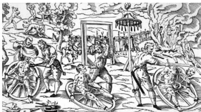
Teilipyöriä ja teilausta eri tavoin 1500-luvun lopun Saksassa. Kuva: Lucas Mayer 1589, Wikimedia.

Kulttuurisissa tulkinnoissa teloituksissa on voitu nähdä jopa makaaberia kauneutta. Kuolemanrangaistuksen täytäntöönpano oli rituaali, joka toi näkyväksi kaikkein vähäisimpiä ja näkymättömiä yhteisön jäseniä, jotka syntinsä julkisesti tunnustaessaan saivat käyttää myös omaa ääntään, jota siinä tilanteessa kuunneltiin. Tästä syystä teloitetuksi tuleminen oli jopa alkanut houkutella joitakin kaupunkien alimpien yhteiskuntaryhmien nuoria ja turvaverkkoja vailla eläneitä naisia.