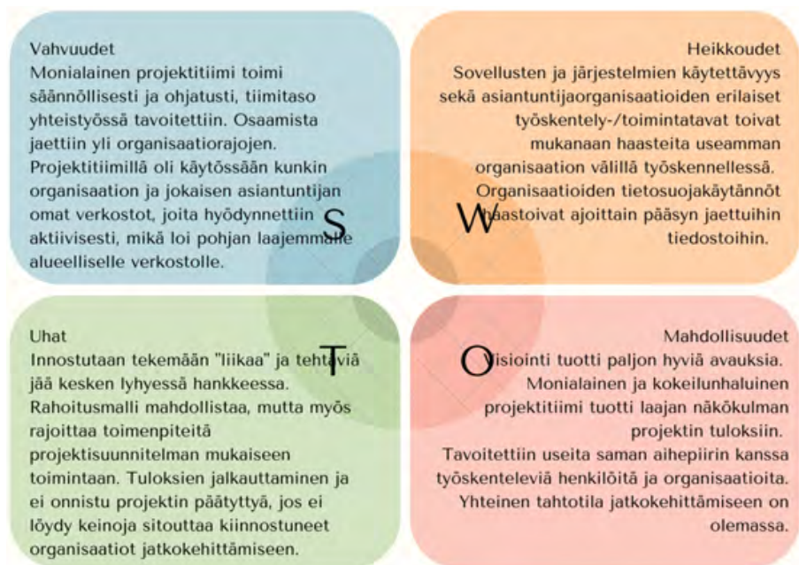
Kuvio 4. Projektitiimin tiivistetty näkemys ja kokemus työskentelystä hankkeessa.

man alueellisen verkoston syntyminen ja hyödyntämisen hankkeessa. Kolmen eri organisaation erilaiset toimintatavat, tietosuojakäytännöt ja sovellusten ja järjestelmien yhteiskäyttöisyys nähtiin itsearvioinnissa yhtenä heikkoutena. Innostava yhteinen työskentely projektitiiminä tuotti paljon uusia avauksia, mikä nähtiin myös yhtenä uhkana. Alkuperäiset tiedostot on tallennettu joko JAMK:n Onedrive kansioihin tai tutkimusten osalta IDA-järjestelmään. Jaetut kansiot ja tiedostot eivät aina toimineet kaikille ja jakamista jouduttiin tekemään useaan kertaan, mikä koettiin yhtenä heikkoutena projektin työskentelyssä. Myös Teams-alustan vaihtaminen kesken työpäivän koettiin ongelmalliseksi ja sen käytöstä luovuttiin (Teams-tiiminä). Hankkeen rajalliset resurssit ja hanke-suunnitelma tuli pitää mielessä, eikä kaikkia hyviä ideoita voitu hankkeen puitteissa toteuttaa. Itsearvioinnissa pohdittiin myös sitä, että jäävätkö hankkeen tuotokset ja tulokset hyödyntämättä hankkeen jälkeen, jos ei löydy rahoitusta ja tahtoa jatkokehittämiselle. Projektitiimillä on kuitenkin vahva kokemus ja näkemys, että jatkokehittämiseen on keskusomalaisilla simulaatiotoimijoilla yhteinen tahtotila, ja SimO-hankkeen pohjalta kirjoitetaan jatkohanhakemus vuoden 2023 aikana.