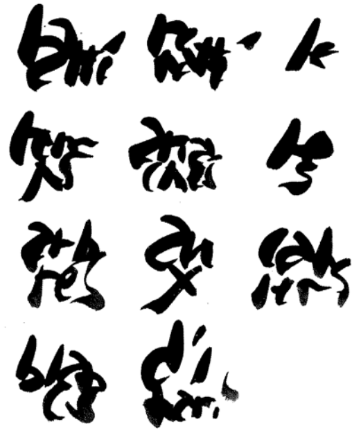
Kuva 3. Dotremontin sanapiirros ”palmikoitu uudelleenpalmikoitu” vuodelta 1964 (Dotremont 2022, 19).

viitanee Suomen ranskankieliseen nimeen Finlande . Dotremontin kokemana näynomaisuus sijoittuu tiettyyn maantieteelliseen alueeseen, jonka tunnusmerkkejä hän tekstissään kartuttaa 39 .