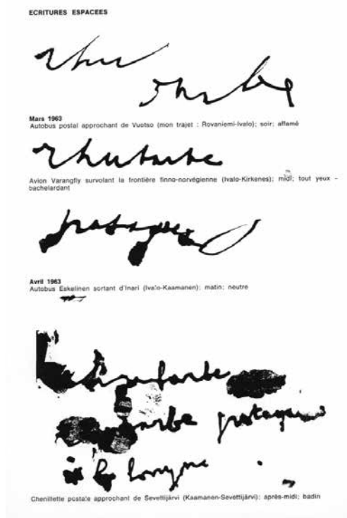
Kuva 5. Kirjoituskokeilu Écritures espacées (Tilla-Liisa Kirjoittaja) vuoden 1964 matkalta Saamenmaalle (Dotremont 1964).

Logogrammien luomisen edellyttämä liike paikallistuu kirjoittavaan kehoon: ”Eräänä päivänä nousin ylös, sillä halusin kirjoittaa suuremmille arkeille [...] ja siitä seurasi koko kehoani liikuttava tanssi, koreografia, ja siten onnistuin piirtämään.” 47 Piirtäminen ja tanssi ovat metaforia kirjoittamisen/piirtämisen välisen eron ylitykselle ja logogrammien luomisen keholliselle ulottuvuudelle. Dotremontin näkemyksen mukaan jokaisella on ainutkertainen keho, joka vaikuttaa luomisen yksilöllisyyteen. Hänelle painetut kirjat näyttäytyivät tekijöidensä epätäydellisinä edustajina, mutta käsikirjoitukset sisälsivät ”aidon”, fyysisen jäljen tekijästään. Hän toteaa: ”Kaikki te kirjoitatte epäjohdonmukaisesti eri syistä johtuen – ei vähiten siksi, että merkitys sanelee kirjoituksen, koska teksti ei virtaa säännönmukaisesti, mutta myös siksi, ettette ole eikeitään, koska ette ole kuolleita, koska ette ole täydellisiä, koska minä tahansa hetkenä keksitte itsenne...” 48 Näin ollen jokainen Dotremontin poetiikan keinoin luotu teksti synnyttää oman ajallisesti ja paikallisesti spesifin singulariteettinsa.