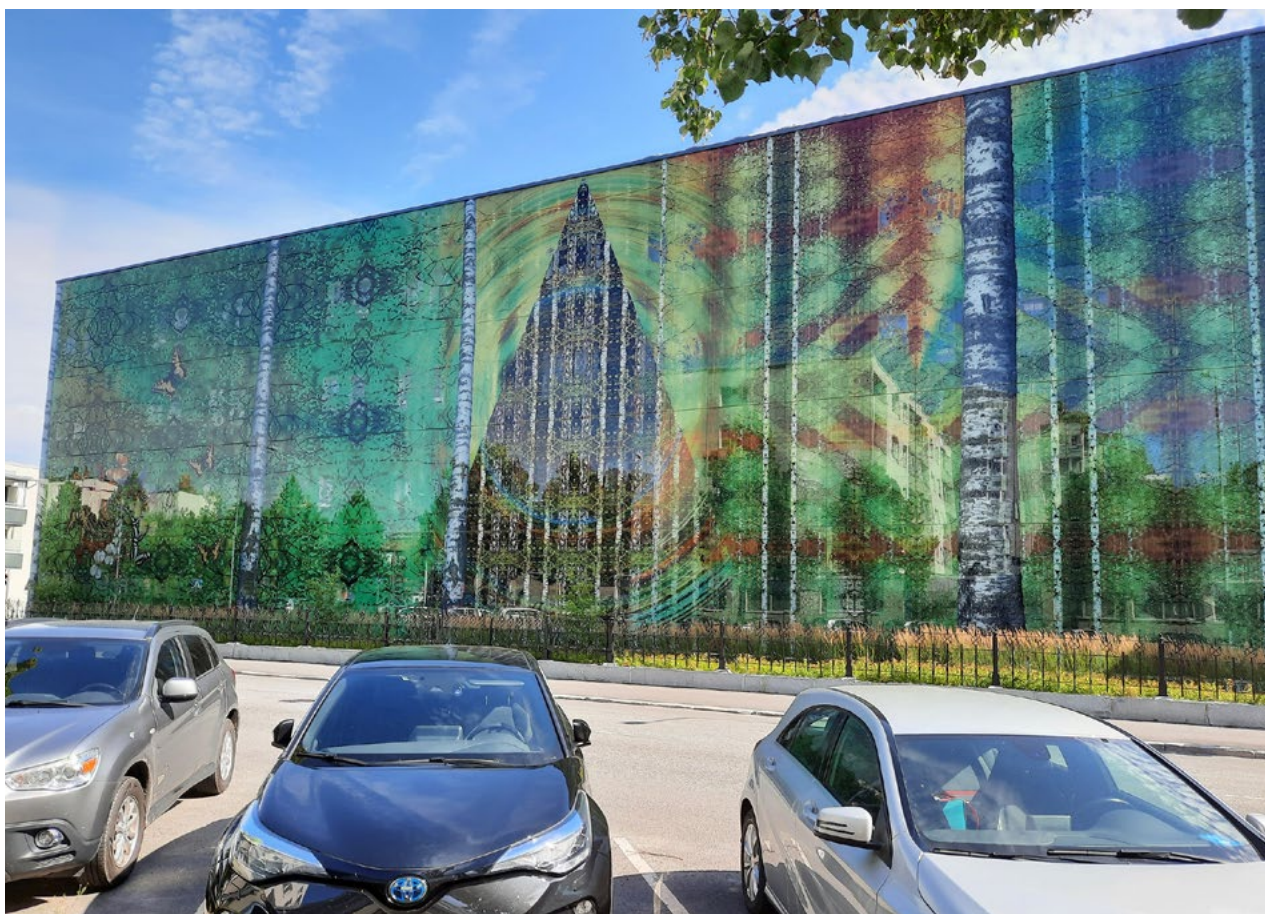
Kuva 4. Lauri Nykoppin suunnittelema, Mikkelin keskussairaalan Perhetalon julkisivuissa oleva Koivupuisto -teos (2019).

tua. Myös teosten kohdeyleisöjen ja niiden monikulttuurisuuden huomiointi vaihtelivat muun muassa teosten ripustuskorkeuden ja sairaaloiden kappeleiden tunnustuksellisuuden osalta. Taiteen julkisuus on yksi keskeinen sairaalataiteen tavoite, mutta havaintojemme perusteella julkisuus toteutuu vaihtelevasti.