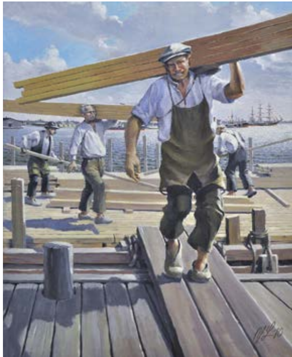
Lastin purkamista lotjasta lautatarhalle.