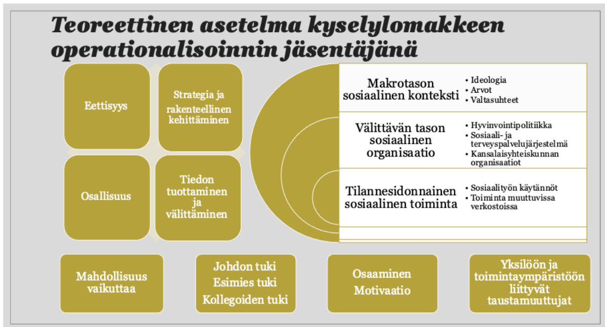
Kuvio 1. Teorettinen asetelma kyselylomakkeen operationalisoinnin jäsentäjänä