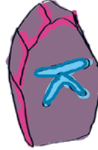
Reiluus HALUAN KOHDELLA KAIKKIA REILUSTI