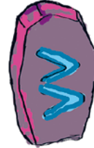
Ystävyys HALUAN OLLA HYVÄ YSTÄVÄ MUILLE