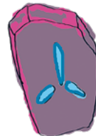
Kiitollisuus HALUAN OLLA KIITOLLINEN PIENISTÄKIN ASIOISTA