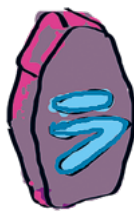
Vastuullisuus HALUAN TOIMIA FIKSUSTI JA OTTAA MUUT HUOMIOON