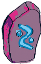
Hyväksyminen HALUAN ETTÄ MINUT JA MUUT HYVÄKSYTÄÄN SELLAISENAAN