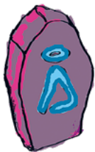
Roolimalli HALUAN OLLA ESIMERKINÄ MUILLE