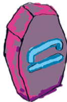
Luotettavuus HALUAN ETTÄ MINUUN LUOTETAAN