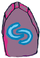
Auttaminen HALUAN AUTTAA MUITA