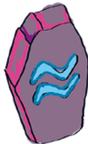
Luovuus HALUAN OLLA TAITAVA MUSIIKISSA TAI TAITEISSA