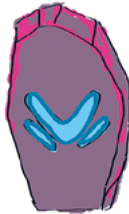
Sisukkuus EN LANNISTU VASTOINKÄYMISSÄ HUOLIMATTA