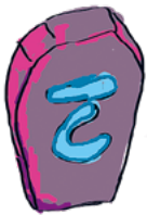
Kunnioitus HALUAN KUNNIOITTAAN ITSEÄNI JA MUITA