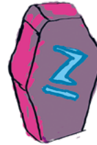
Viisaus HALUAN OPPIA JA KEHITTÄÄ