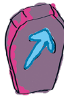
Kehittäminen HALUAN OPPIA UUSIA TIETOJA JA TAITOJA