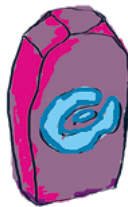
Kaveruus HALUAN TULLA TOIMEEN KAIKKIEN KANSSA