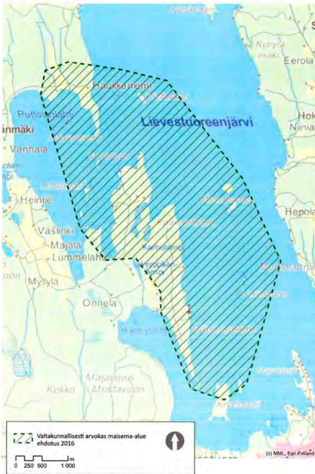
Kuva 7. Hyypäänvuoren suojeluun ehdotettu maisema-alue (KSU 2016, 51)