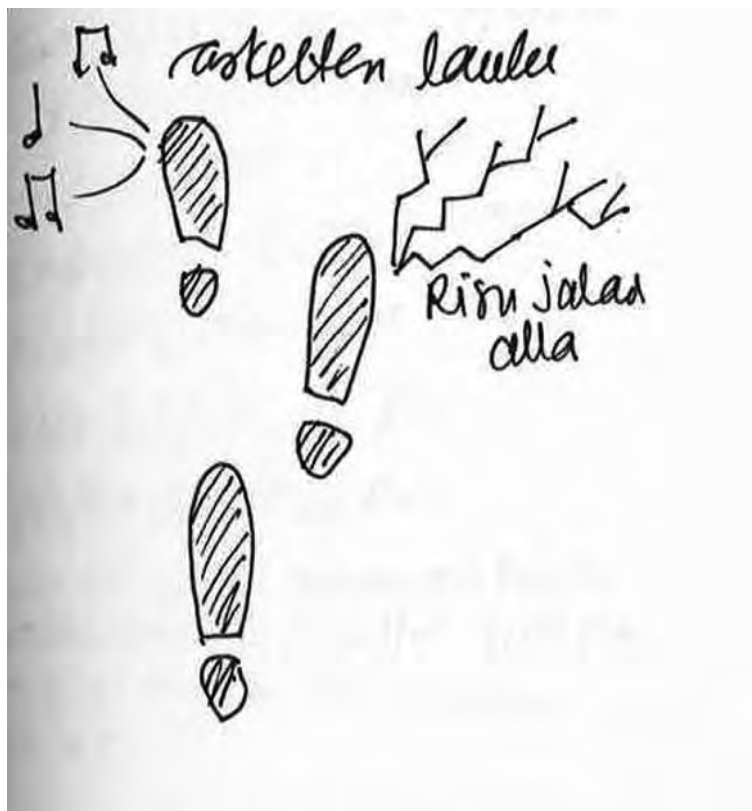
Kuva 5: Sari Mäki-Penttilä.

Kuuntelu ja kirjoittaminen voivat tällöin olla yksi ja sama asia. Käveleminen ja kuunteleminen voivat muodostua ympäristön kirjoittamiseksi, jossa askeleet kirjoittavat maahan ja kehon äänet ilmaan omia merkkejään. Kävelevä ja kuunteleva ihminen huomaa olevansa yksi biosemioottisia merkkejä jättävä toimija muiden joukossa.