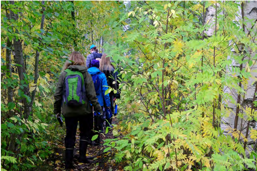
Kuva 1: Pauline Oliverosin harjoite Extremely slow walk .

Oliverosin syväkuuntelumenetelmä tarjoaa teoriaa ja käytäntöä yhdistävään taideperustaiseen toimintaan käytännönläheisen pohjan. Oliveros (2005, xxi–xxv) korostaa syväkuuntelumenetelmää kuvaillessaan ihmisen totunnaisen kuuntelutavan ja syväkuuntelun eroa. Tyypillisesti kehon vastaanottamasta äänellisestä informaatiosta vain osa käsitellään tietoisesti (Oliveros 2005, 18–19). Aistimisen tapojen totunnaisuuksiin onkin hyvä kiinnittää huomiota so-