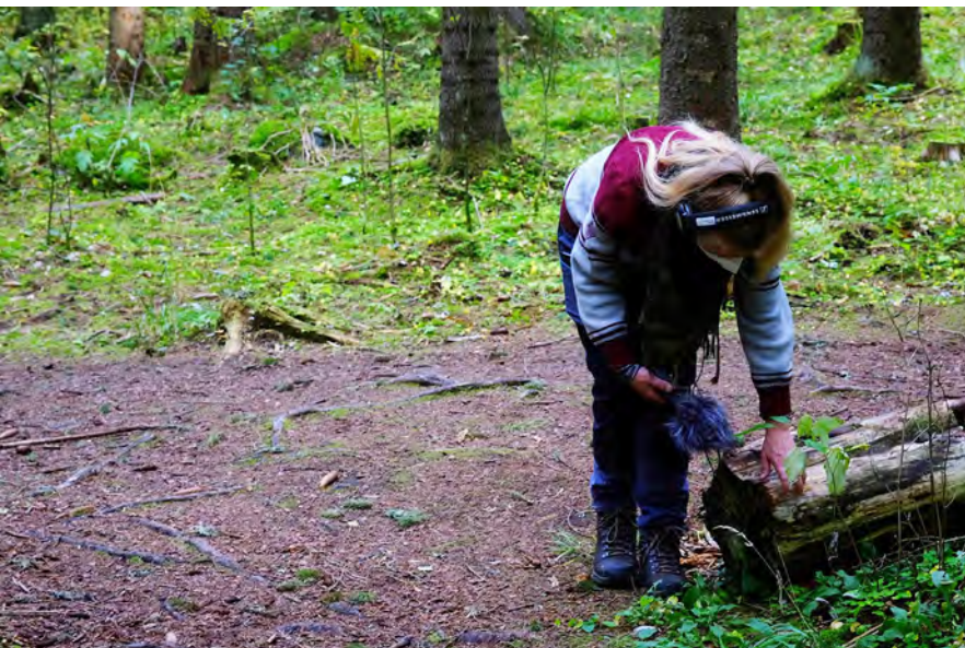
Kuva 4: Puun kuunteleminen korvien, mikrofonin ja kosketuksen kautta. Pauline Oliverosin harjoitteisiin sisältyy myös äänien vastaanottamiseen herkistäviä teknologiavälitteisen kuuntelemisen harjoitteita.