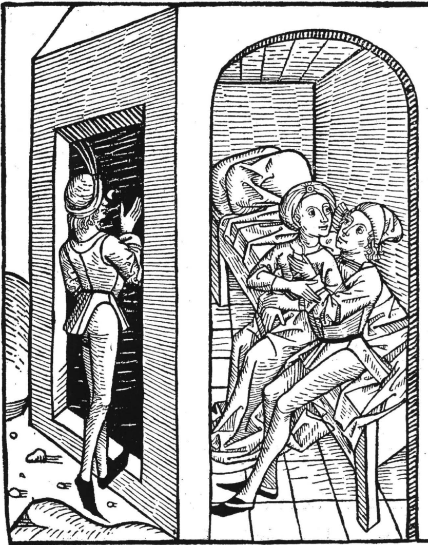
Esimerkki keskiaikaisesta bordellista. Taiteilija pelkistänyt kuvauksensa olennaisimpaan: asiakkaisiin, prostituoituun ja vuoteeseen. Saksalainen puukaiverrus 1400-luvulta.