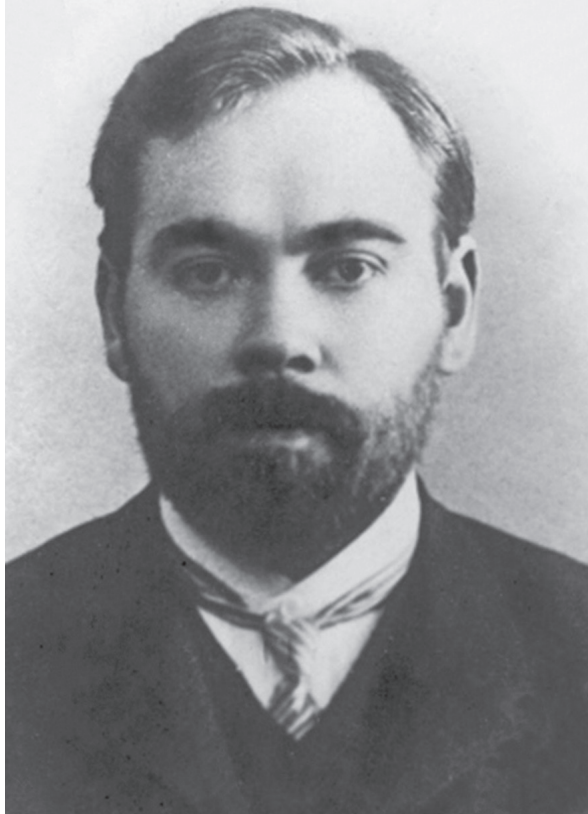
Aleksandr Bogdanov, proletaarikulttuurin teoreetikko, kirjailija ja Proletkult-järjestön perustaja.

toli Lunatšarskin kanssa Caprin ja Bolognan puoluekouluja tarkoituksenaan kouluttaa työväenluokkaistaustaista intelligentsijaa sekä auttaa sitä kehittämään omaa, proletaarista kulttuuriaan. Puoluekoulut olivat lyhytikäisiä, mutta proletaarisen kulttuurin kehittäminen pysyi Bogdanovin tavoitteena tämän jälkeenkin.