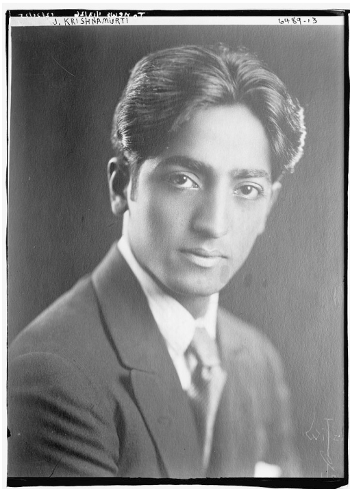
Intialainen ajattelija Jiddu Krishnamurti vuonna 1900.

Krishnamurti pyrkii ylittämään sanat ja ajattelun. Tietysti joudumme käyttämään kumpaakin arkielämässämme, mutta sanat eivät ole varsinainen tie ”totuuteen”, jos sitä edes on olemassa. Mitä sitten seuraa, jos oivallamme, etteivät sanat kerro esitettyä