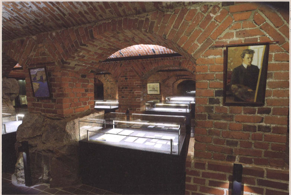
Viapori-Suomenlinna - Kolmen valtakunnan linnoitus 1748-2021 on avoinna 30.9.2022 saakka.

Näyttelykokonaisuus sijaitsee Kansallisarkistossa ja Suomenlinnakeskuksessa, ja siinä