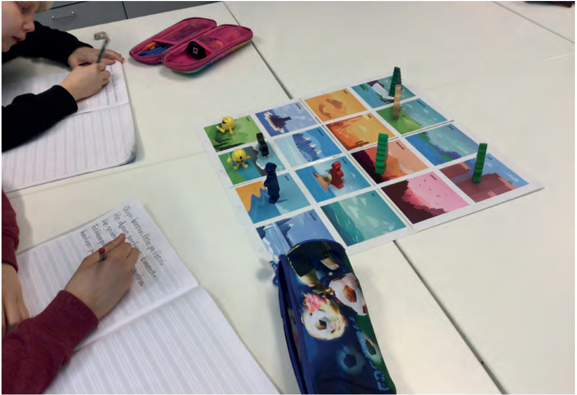
Kuva 1. Oppilaita kirjoittamassa yhteistä tarinaa.