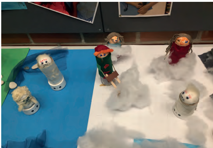
Kuva 6. Norppatyön robotit.