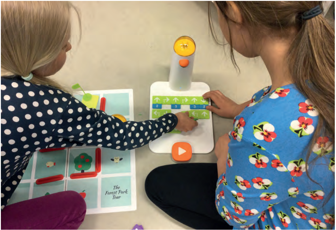
Kuva 2. Tarinan ohjelmointia Matatalabilla.