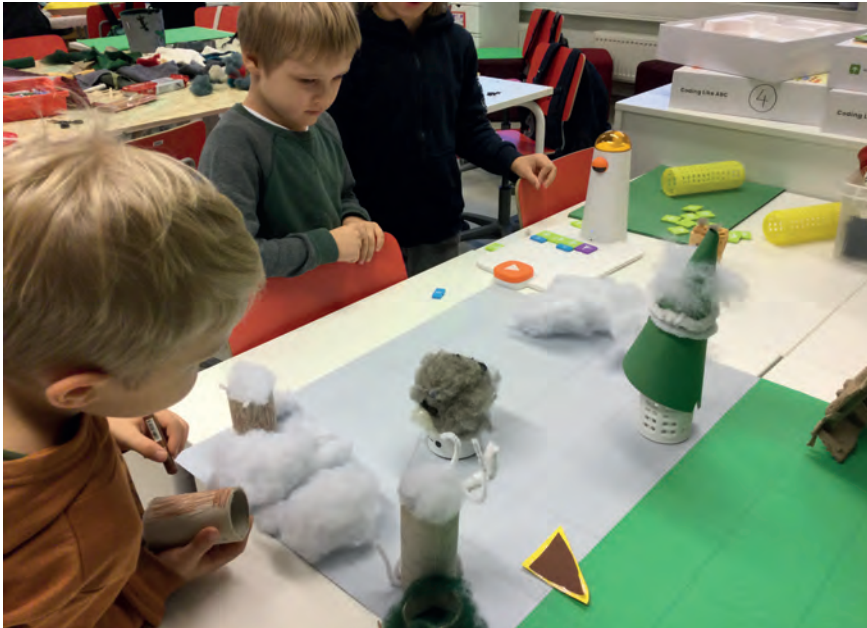
Kuva 5. Ohjelmointi- ja askartelutyö käynnissä.

Tämä monialainen oppimiskokonaisuus oli osana kiinalaisten organisoimaa kansainvälistä ohjelmointikilpailua, jossa tavoitteena oli uhanalaisten eläinten suojeleminen. Ohjelmointiosuus toteutettiin Matatalabin välineillä, mutta ympäristö ja alusta, jossa ohjelmoidut "robotit" liikkuvat, askarrettiin teeman ja eläinten elinympäristön mukaisesti. Aihetta lähestyttiin hyvin oppilaslähtöisesti ja opetussuunnitelmassa (Opetushallitus 2014) olevan monialaisen oppimiskokonaisuuden tavoitteiden mukaisesti. Ryhmätyö toteutettiin ensimmäisessä luokassa kahdessa eri ryhmässä.