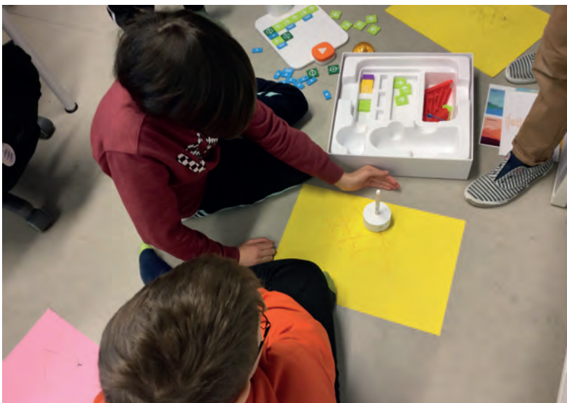
Kuva 3. Piirto-ohjelmointia.

Matatalab-ohjelmointilaitteisto sisältää erilaisia oheistuotteita, joista yksi on taidepaketti. Sen avulla voi harjoitella piirto-ohjelmointia. Mahdollisuutena on piirtää ohjelmointimalleista esimerkiksi erilaisia tasokuvioita robottia ohjelmoiden. Ohjelmitavaan robottiin asetetaan kynä, joka piirtää ohjelmoidun kuvion. Kuvion muodostuminen perustuu perusohjelmointitoimintojen lisäksi kulman erilaisiin astemääritelmiin.