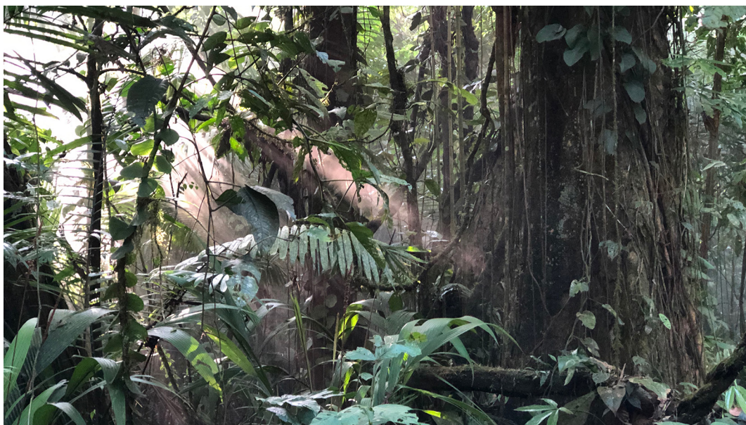
Kuva 2. Trooppista metsää Costa Ricassa.

posthumanistisiin näkemyksiin ei-inhimillisistä taiteilijoista (ks. Deleuze & Guattari 1987, 316–317). Kuuntelijan huomio kääntyy ei-inhimilliseen toimijuuteen, eri lajien ja lajiyksilöiden luonnonympäristöissä tuottamien tekstuurien ilmaisuvoimaan.