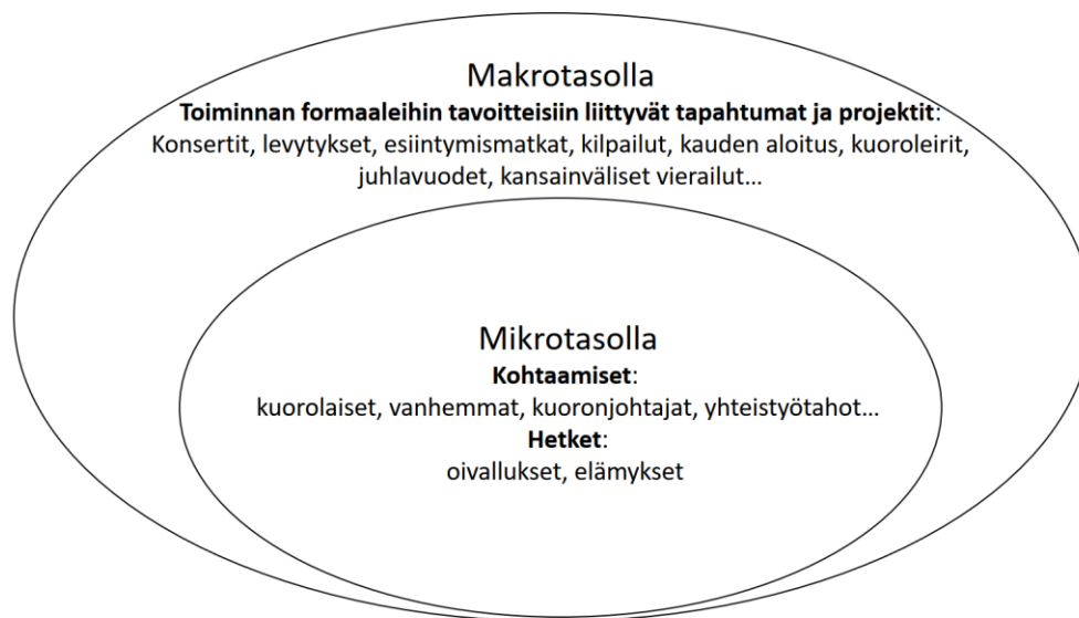
KUVIO 2 Kuoronjohtajan työni kokemustihentymät