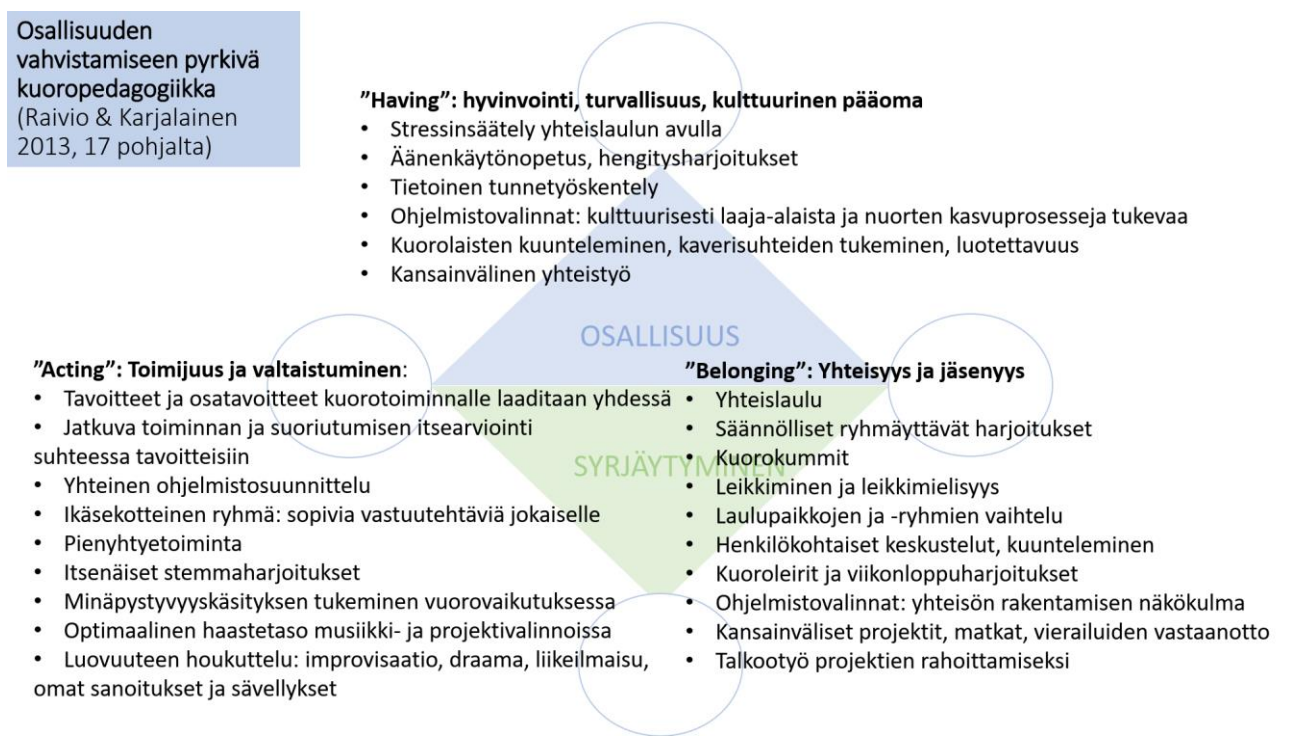
KUVIO 4: Osallisuuden vahvistamiseen pyrkivä kuoropedagogiikka