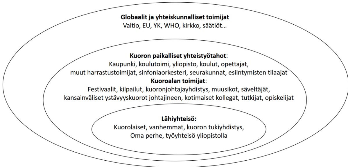
KUVIO 1 Pedagogiseen ajatteluuni ja toimintaani vaikuttavan sosiokulttuurisen kontekstin toimijat.

Globaalit ja yhteiskunnalliset toimijat luovat sekä nuorisokuorotoiminnan arvopohjaan että käytänteisiin raamit, joiden puitteissa toimintaa toteutetaan. Lainsäädäntöä on noudatettava, yhteiskunnallisia arvoja ja arvostuksia kunnioitettava ja toiminta suhteutettava esimerkiksi valtakunnallisiin opetussuunnitelman perusteisiin. Kuoron tukiyhdistys on sopimuksin sitoutunut yhteistyöhön kaupungin koulutoimen kanssa, minkä myötä toiminnalta edellytetään sitoutumista samaan arvopohjaan ja normeihin. Yhteiskunnalliset päätökset ja lainsäädäntö tulevat siis lähemmäksi paikallisten yhteistyötahojen (esim. kaupungin koulutoimi) kautta ja saavat toteutuksensa lähiyhteisössä sekä työnantajana toimivan, vanhemmista koostuvan tukiyhdistyksen päätösten muodossa että kuoronjohtajan suunnittelu-, toteutus- ja arviointityössä sekä kuorolaisten panoksessa. Toisaalta kansainvälisessä nuorisokuoroyhteisössä vallitsevat monenlaiset arvot ja normit voivat toisinaan olla ristiriidassa vaikkapa suomalaisen koulukulttuurin kanssa. Esimerkiksi käsitys kuorolaisen toimijuuden määrästä ja laadusta voi poiketa merkittäväällä tavalla, jolloin kuoronjohtajana on tehtävä valintoja yhtäältä suhteessa niihin arvoihin ja normeihin, joihin oma kuoro on sitoutunut, toisaalta suhteessa vaikkapa kansainvälisen ystävyyskuoron arvojen ja normien kunnioittamisen ihanteeseen. Lopputuloksena saattaa olla voimakkaita tunteita nostattava kompromissi, jota joutuu reflektoida sekä itse että yhdessä lähiyhteisön kanssa.