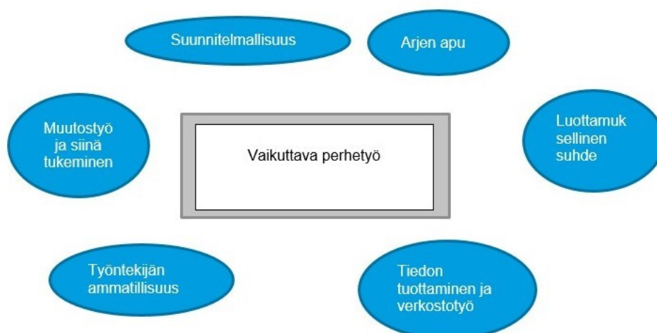
Kuvio 4 Perhetyön vaikuttavuuden tekijät

Samalla, kun lakia uudistettiin uuden sosiaalihuoltolain (sosiaalihuoltolaki 2014/1301) voimaantulon yhteydessä. Tällöin lastensuojelun avohuollon tukitoimia käsittelevään 36 §:ään (Lastensuojelulaki 13.4.2007/417) lisättiin uusina käsitteinä tehostettu perhetyö ja perhekuntoutus. Tämän uudistuksen jälkeen lastensuojelun asiakkaille tarkoitettu perhetyöstä on vakiintunut käytettäväksi nimitys tehostettu perhetyö erotuksena sosiaalihuoltolain (sosiaalihuoltolaki 2014/1301) mukaisesta perhetyöstä. (Alatalo & Lappi & Petrelius 2017, 13,17.)