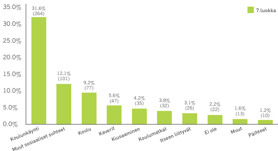
Kuvio 2. Nuorten mainitsemien huolien ja ikävien asioiden yleisyys 7. luokalla (% kaikista vastaajista, suluissa vähintään yhden huolen maininneiden nuorten määrä)

muut ja ei ole, joihin tuli vähintään yksi maininta alle 10 prosentilta nuorista. Huomionarvoista on, että mainintojen määrä oli 6. luokkaan verrattuna lisääntynyt selvästi luokassa koulunkäynti ja vähentynyt selvästi luokassa kaverit, muut sosiaaliset suhteet ja kiusaaminen.