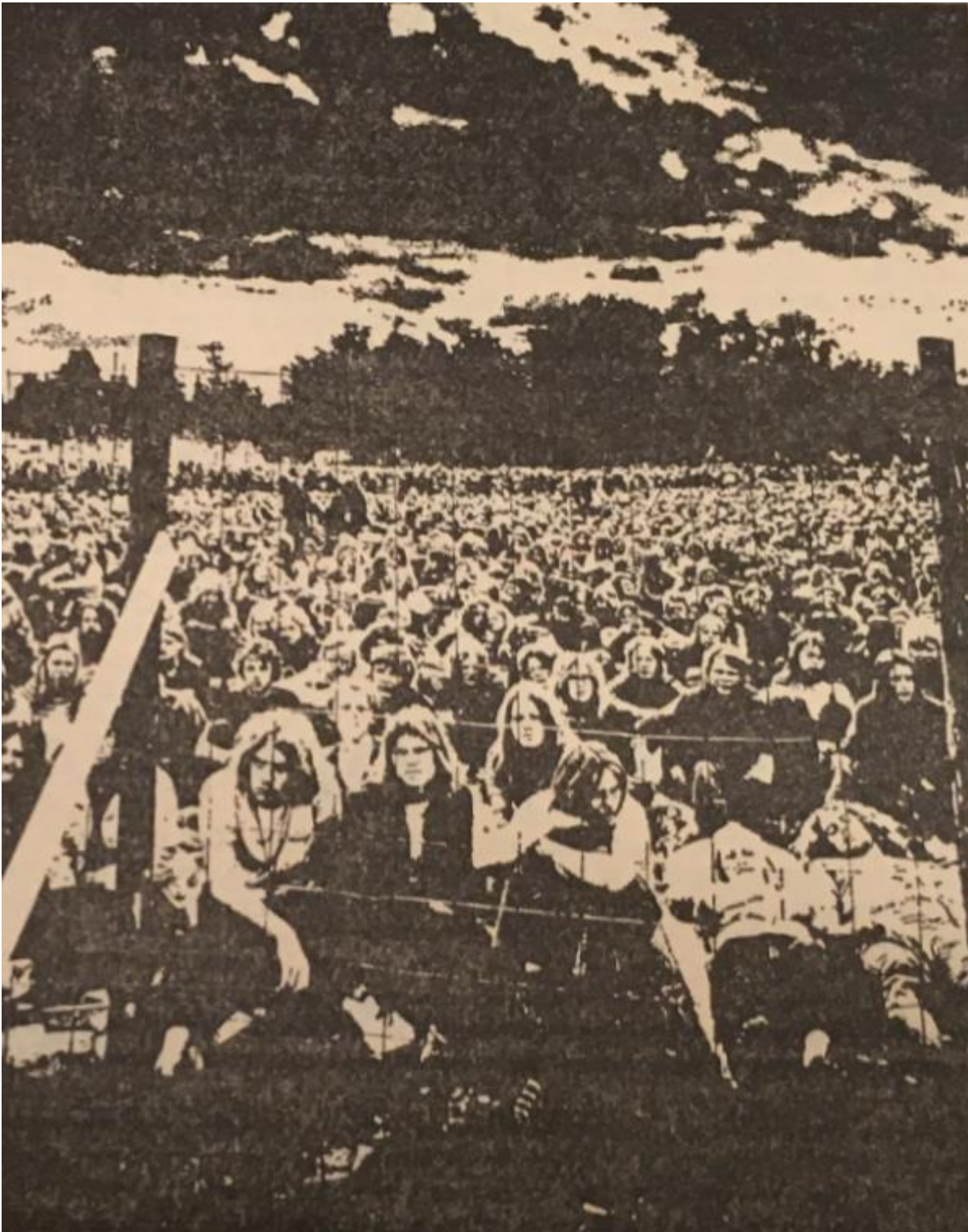
Kuva 5. Demokraattiseen yhteistyöpolitiikkaan 298