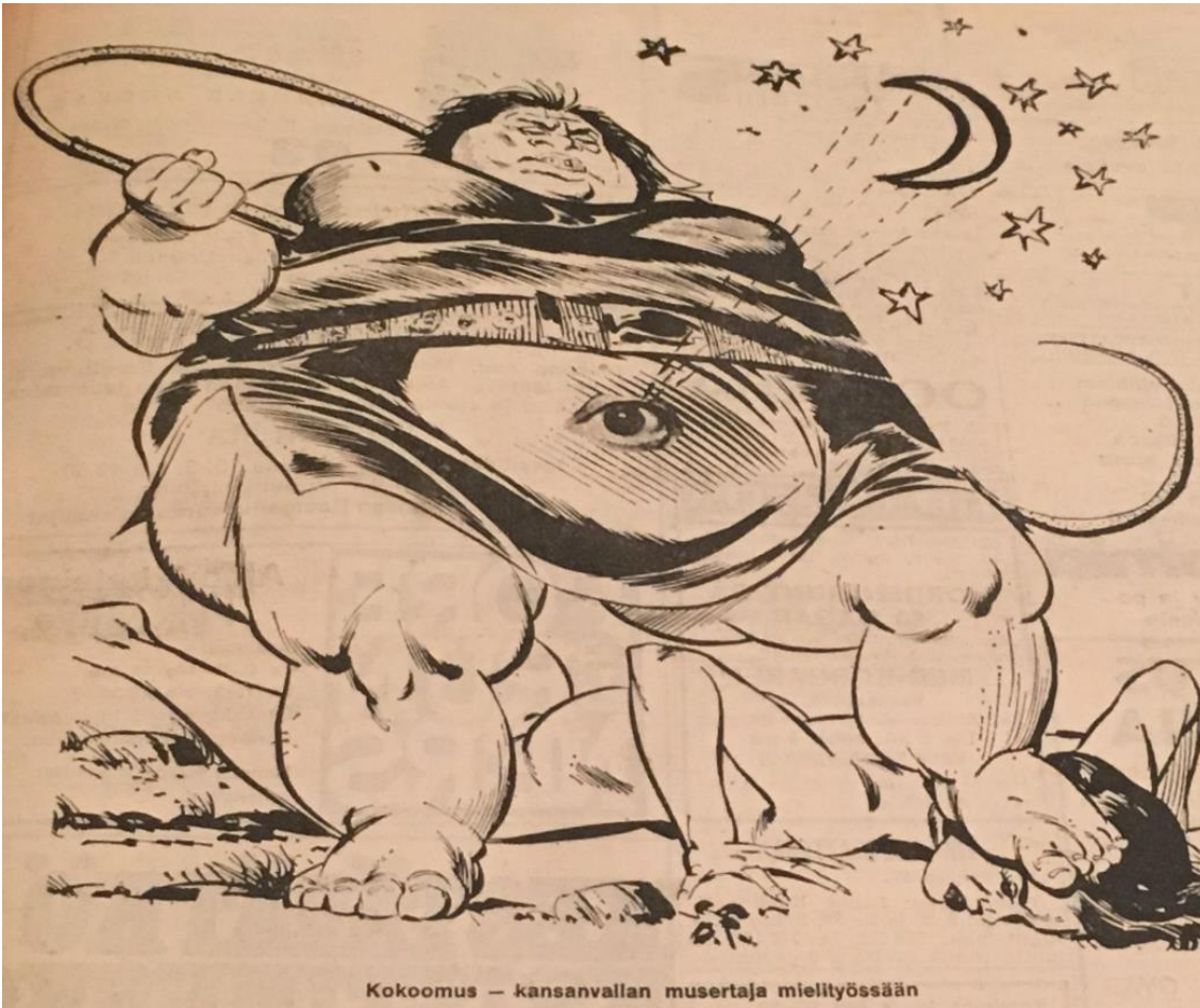
Kuva 3. Kokoomus – kansanvallan musertaja mielityössään 296