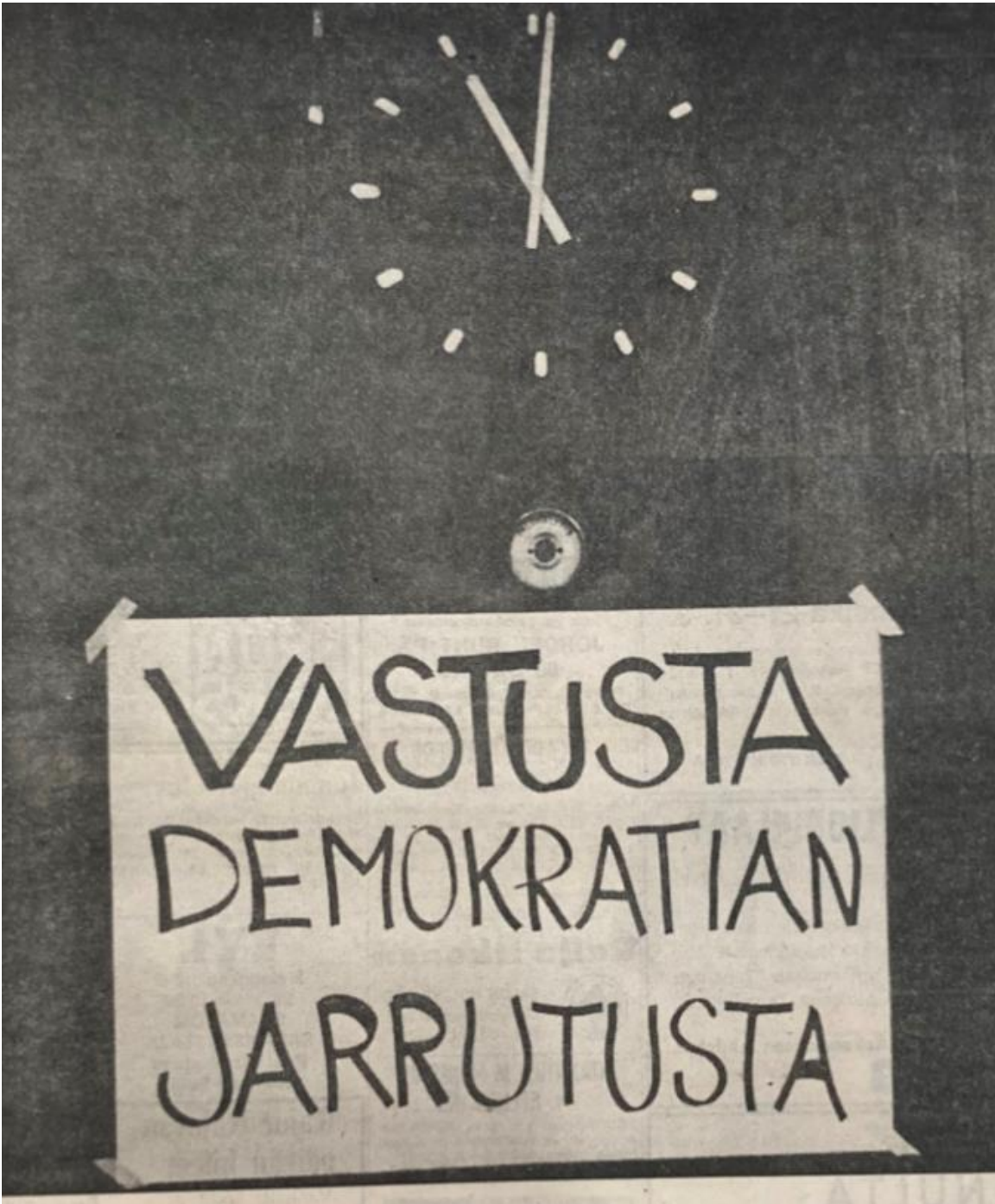
Kuva 2. Vastusta demokratian jarrutusta 295