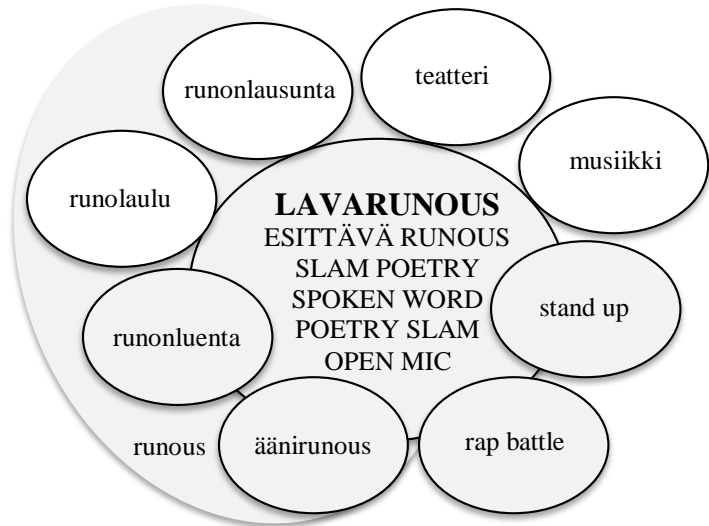
Kuva 2. Hahmotelma lavarunouden ja sen sisarustaiteiden suhteista.

Heijalan kaavio on pääpiirteittäin toimiva lähtökohta myös omassa tutkimuksessani. Mielestäni kaaviosta kuitenkin puuttuu eräs lavarunouden sisällä tai läheisesti sen vierellä vaikuttava suullisen runouden muoto, äänirunous. Tämä tuli myös esiin tutkimusaineistossa: