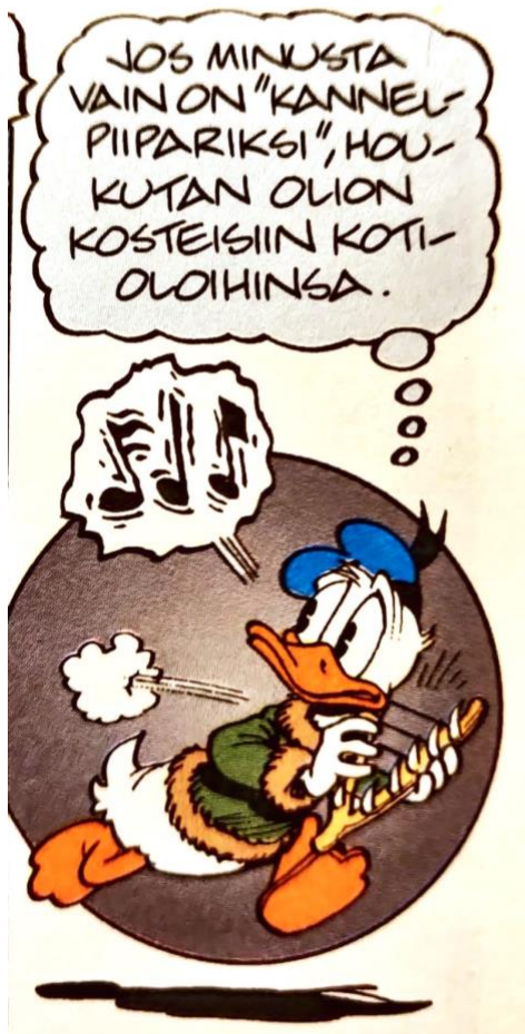
KUVA 3 (Rosa 1999, 31)

Aku Ankka koettaa pelastaa tilanteen ja houkutella Iku-Turson takaisin vesistöön soittamalla kanteletta. Se ei kuitenkaan onnistu aivan yhtä hyvin kuin Väinämöisen tai Louhen soitanta. Aku Ankan soittamat musiikkikuplan reunat ovat rikkonaiset ja röpöiset, mikä kielii epävarmuudesta ja taidottomasta, kenties epävireisestä