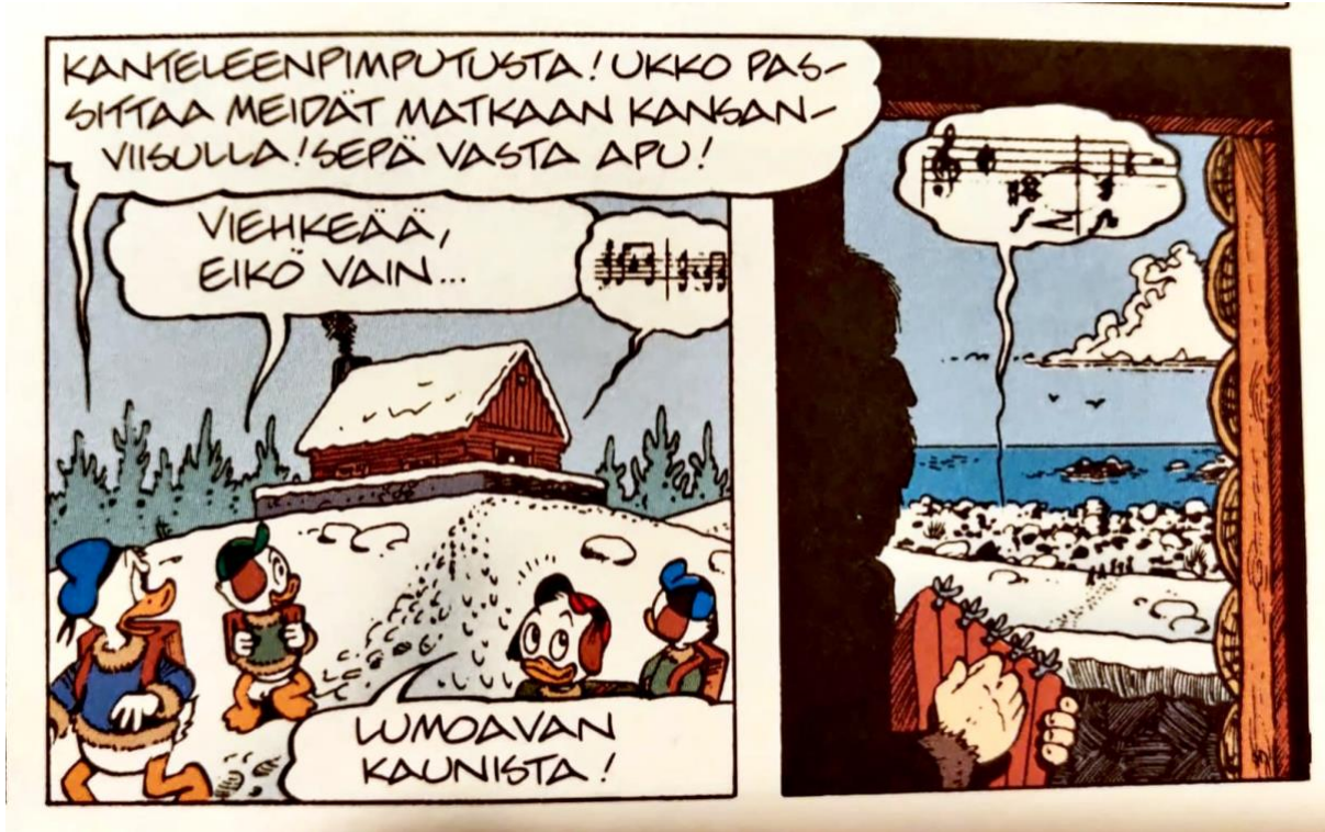
KUVA 1a ja 1b (Rosa 1999, 13)

Ensimmäisessä ruudussa (KUVA 1a) Aku Ankka veljenpoikineen on kävelemässä pois päin pienestä mökistä, josta kantautuu vanhan miehen kanteleellaan soittamaa musiikkia. Musiikki on esitetty samankaltaisessa kuplassa kuin puhe, mutta nuottikirjoituksena. Nuottikatkelma on Jean Sibeliuksen Finlandia op. 26 , tahti 107 sellopartituurista.