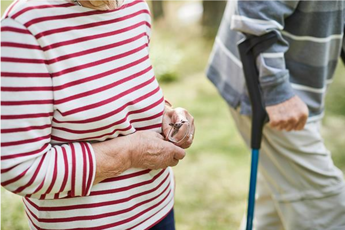
Kuvituskuvana ikääntynyt pariskunta kävelyllä.