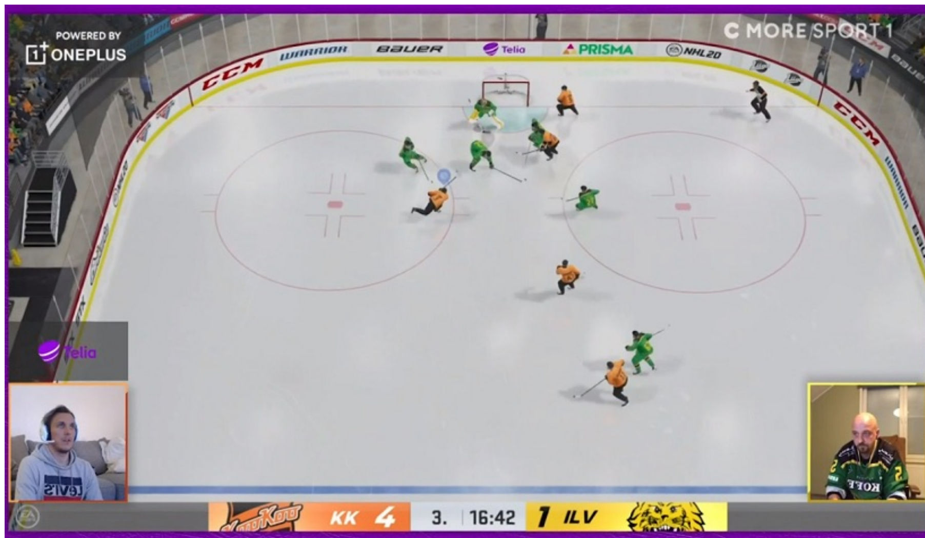
Kuva 3. Sasu Kauppi (vas. KooKoo) ja Sami Hintsanen (oik. Ilves) vastakkain Liigan ePlayoffs-turnauksessa.