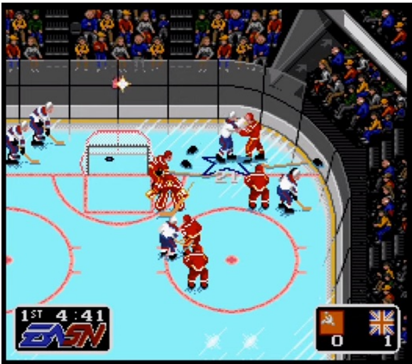
Kuva 1. Neuvostoliiton ja Iso-Britannian välinen kiekkotaisto meni tappeluksi. (EA Hockey, Sega Mega Drive 1991)