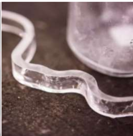
Kuva 8: Maljakosta sahattu osa.