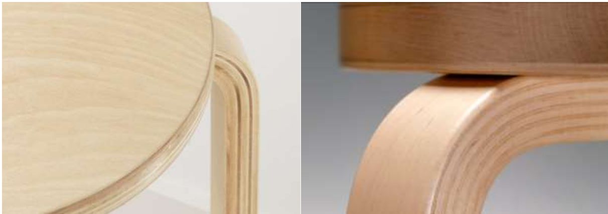
Kuvat 35 ja 36: Vasemmalla Ikean valmistama kopio Frosta ja oikealla aito Aalto-jakkara. Kopion tunnistaa parhaiten tarkastelemalla erityisesti jalan yläosan taivutustekniikkaa.

Aalto-jakkaran jäljitelmät voivat olla tunnistamisen kannalta ongelmallisia. Kopion (kuva 35) erottaa kuitenkin usein jakkaran jalasta, joka on yleensä laminoitua puuta, kun aidon jakkaran (kuva 36) jalka muodostuu massiivipuuhun tehdyistä sahausaukkojen liimalameleista, jotka vaihtelevat hieman valmistusvuodesta riippuen yleensä neljän ja viiden välillä, vanhimmissa tosin voi olla jopa seitsemän. Poikkeuksen tekee sodan jälkeen valmistetut jaksarat, jotka liimapulan vuoksi taivutettiin sinkkaliitoksella. Usein kopioiden istuinosa on massiivipuun sijaan leikattu liimavanerista. Aidon jakkaran tunnistaa myös huonekalusta löytyvästä leimasta, joita on alettu lyödä jakkariihin Artekin toimesta vuodesta 1935, on kuitenkin huomioitava että leima saattaa olla haalistunut tai jäänyt uuden maalikerroksen alle. 288 Mikäli kopioitua jakkaraa myydään aitona Aalto-jakkarana, tällöin kyseessä on tiedollinen väärentäminen ja rikosnimikkeenä petoksen yritys, kaupan onnistuessa petos.