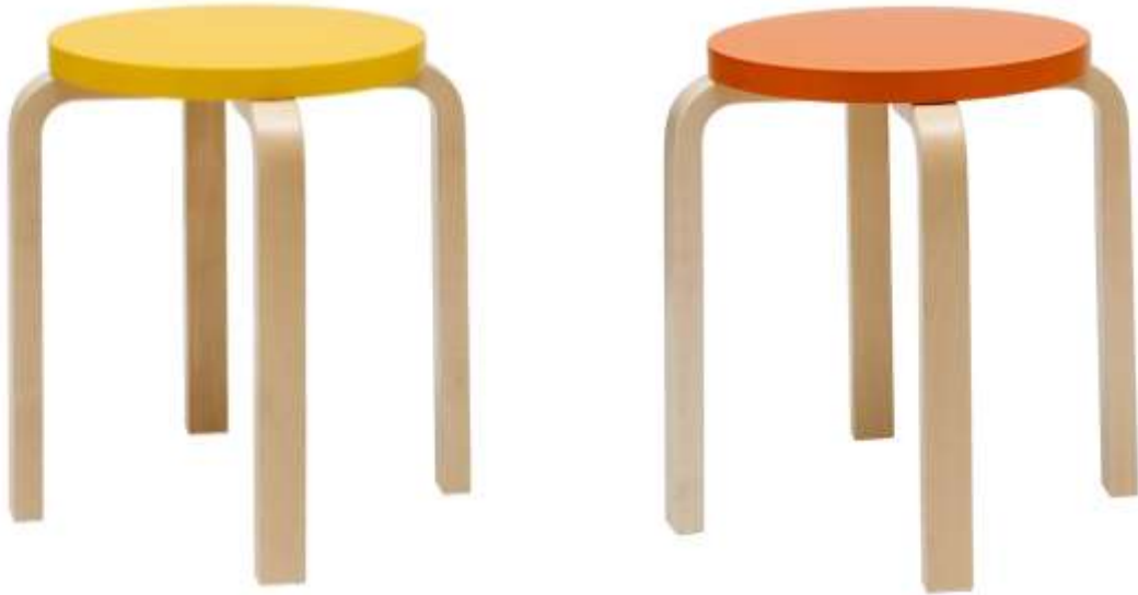
Kuvat 31 ja 32: Artekin juhlamalliston jakkarat keltaisen ja oranssin sävyisellä istuinosaalla.

Artek julkaisi vuonna 2013 E60 -jakkarasta Paimion parantolan 80-vuotisjuhlamalliston, jossa jakkaroiden (kuvat 31 ja 32) istuinpinnat saivat värinsä Alvar Aallon parantolaan suunnittelemissa väreissä. Seuraavana vuonna myös Ikea julkisti uutuusväreillä koristellut Frosta -jakkarat (kuvat 33 ja 34), joiden väritys muistutti huomattavasti Artekin jakkaroiden sävyjä. 287