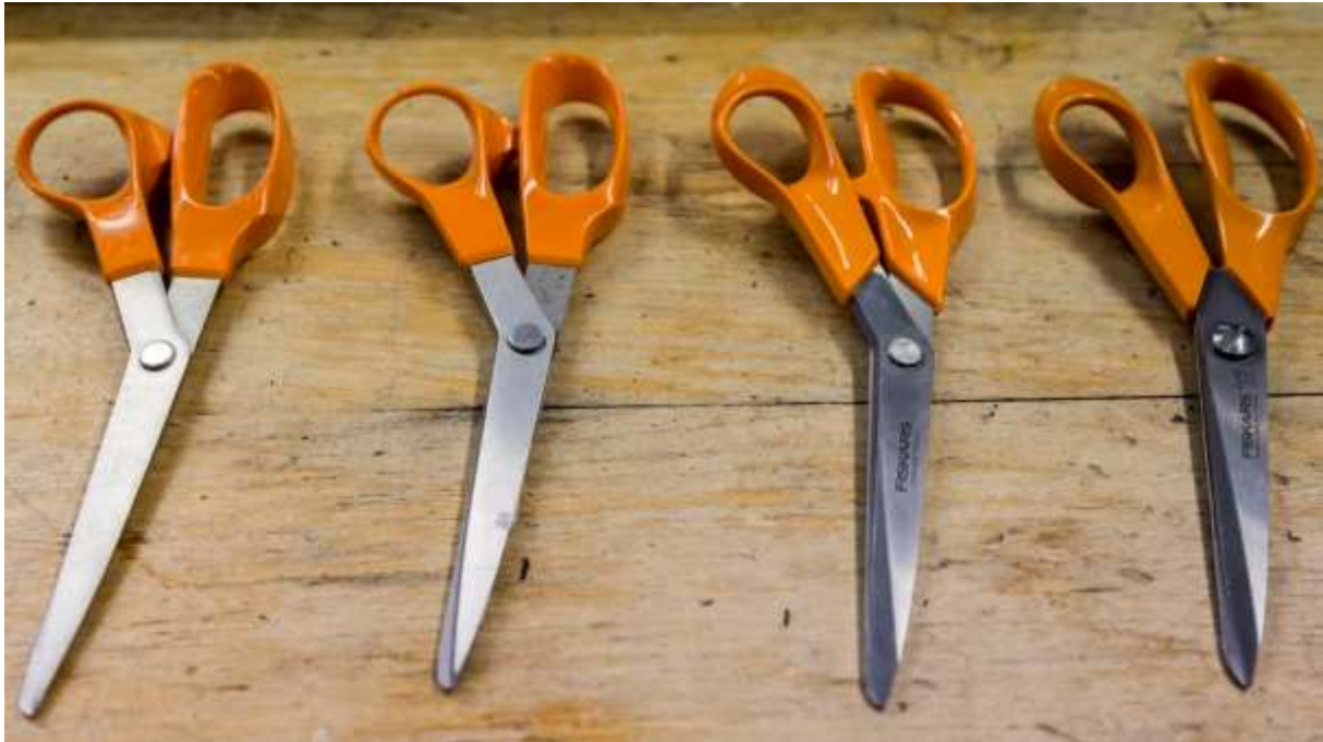
Kuva 46: Fiskarsin saksien kehitys alkuperäisestä nykyiseen.