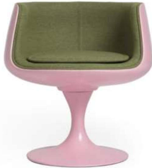
Kuva 45: LifeInteriors-kopio