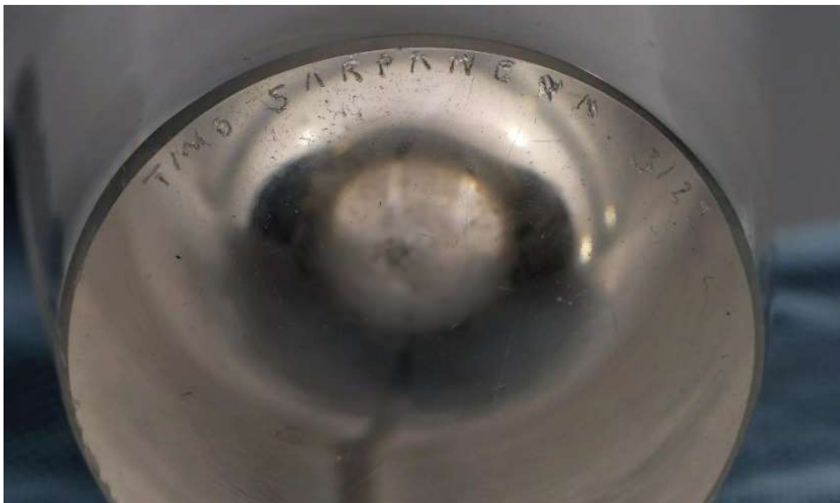
Kuva 13: Väärennetty Timo Sarpanevan signeeraus Tapio Wirkkalan maljakon pohjassa. 261

tunnetun muotoilijan nimiin. 258 Tapausesimerkkinä tässä yhteydessä toimii Tapio Wirkkalan maljakko (kuva 13), jonka pohjaan on signeerattu Timo Sarpanevan nimi. Maljakko osoittaa, että väärentäjät eivät aina ole kovin hyvin perillä väärentämistään esineistä. 259 Myös esimerkiksi Helena Tynellin suunnittelema maljakoita on signeerattu Nanny Stillin nimiin. 260