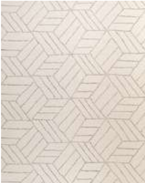
Kuva 40: alkuperäinen kierrätyspuuvillainen Kievari .

eivät halua kilpailla kotimaisten suunnittelijoiden kustannuksella. 291 Koska teoskynnys ei ylity, on Kievari -maton tapauksessa kyseessä kopioiden kohdalla loukkaava jäljennös.