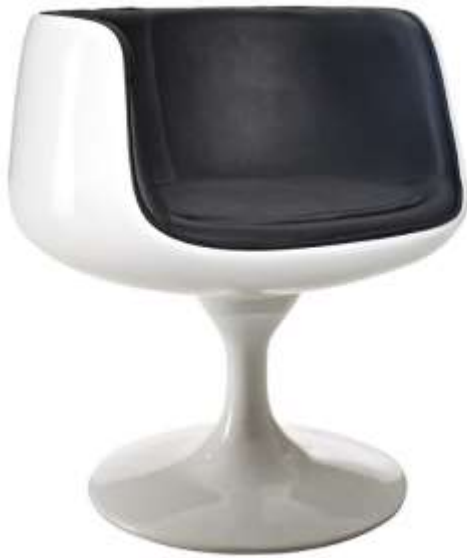
Kuva 44: Alibaba/AliExpress-kopio