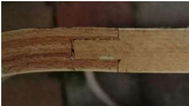
Kuva 37: Aito Paimio-tuoli eli nojatuoli 41