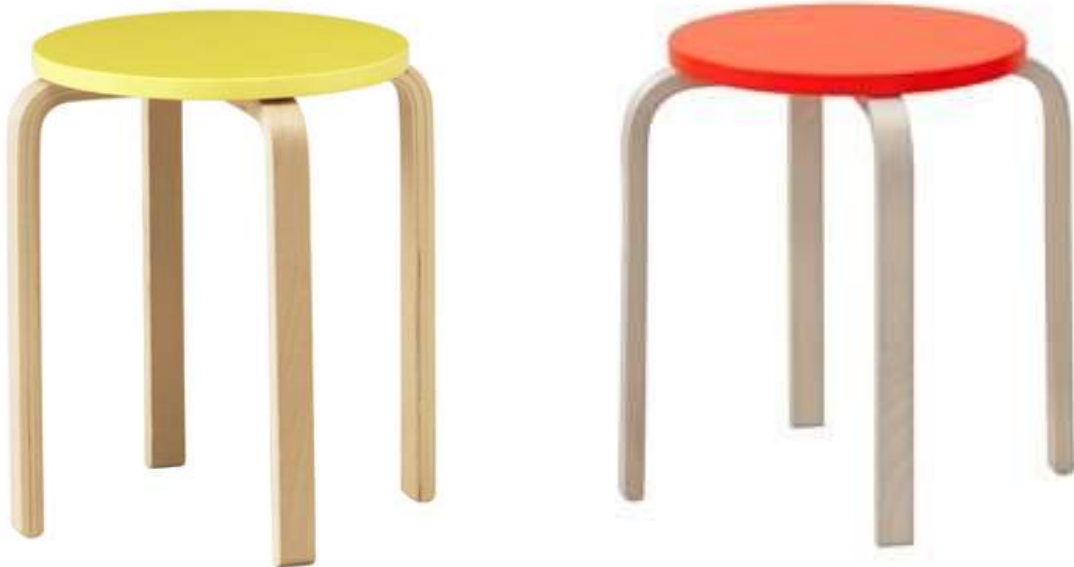
Kuvat 33 ja 34: Ikean Frosta -jakkarat vastaavalla värityksellä.