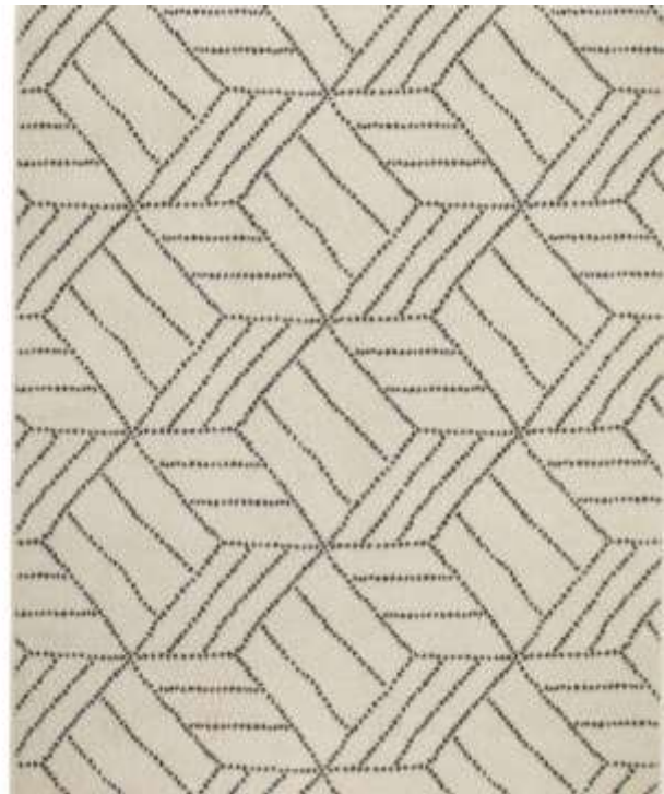
Kuva 41: Jyskin muovinen kopio Ahorn .