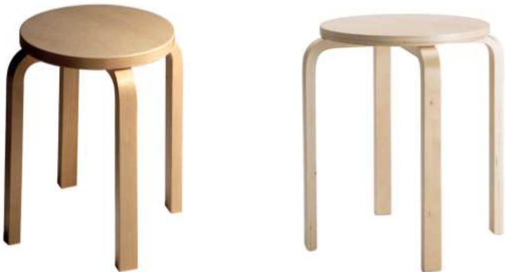
Kuva 29: Aallon E60 jakkara, josta on olemassa lukuisia kopioita. Kuva 30: esimerkkinä kopiosta Ikean Frosta .