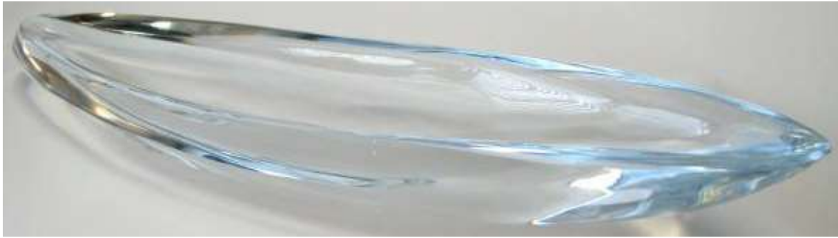
Kuva 2: Tapio Wirkkalan nimiin väärennetty Vene -veistos.