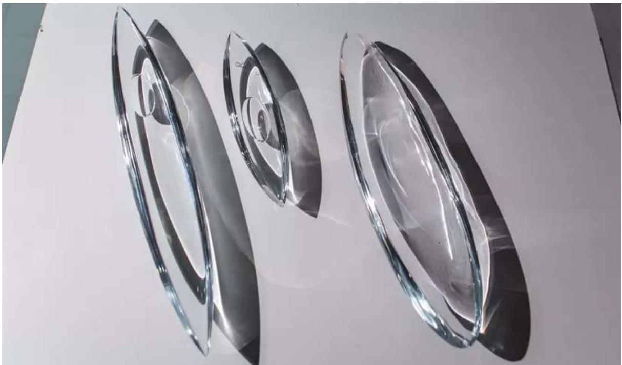
Kuva 3: Väärennettyjä Sarpanevan Kajakkeja ja Wirkkalan nimiin signeerattu Vene Rikosmuseon kokoelmasta.