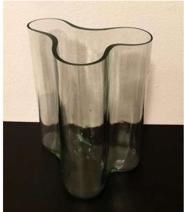
Kuva 51–52: Vasemmalla aito Alvar Aalto -kokoelman maljakko ja oikealla Alvar Aalto -museon hallussa oleva jäljitelmä.

Kuva 51: Iittala tuotokuva, kuva 52: Niina Kelloniemi