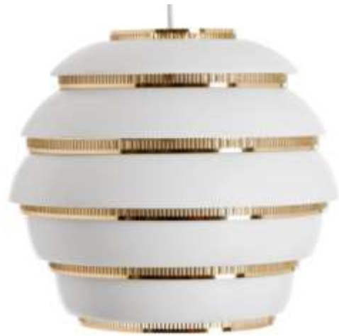
Kuvat 23 ja 24: aidot A331-riippuvalaisimet mustana ja valkoisena.