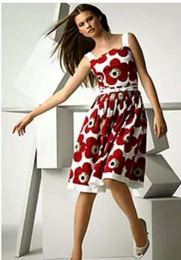
Kuva 48: Dolce & Gabbanan unikkokuvioinen mekko.