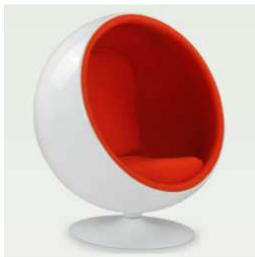
Kuva 28: VOGAn sivuilla 2017 esiintynyt kopio.