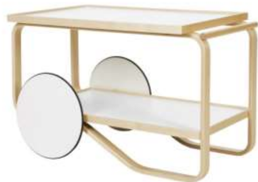
Kuvat 53 ja 54: Alvar Aallon Artekille suunnittelemat tarjoiluvaunut 900 ja 901.