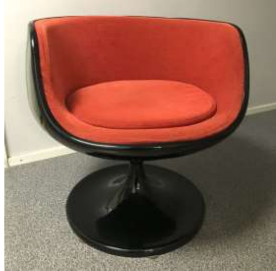
Kuva 42: Alkuperäinen Aarnio nojatuoli Gognac V.S.O.P.