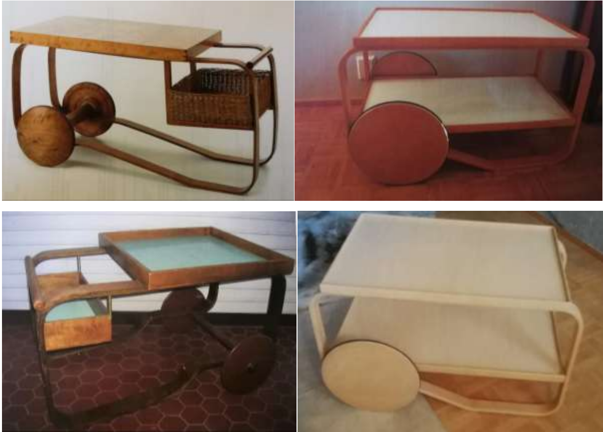
Kuvat 55–58: Erilaisia jäljitelmiä Artekin tarjoiluvaunuista.