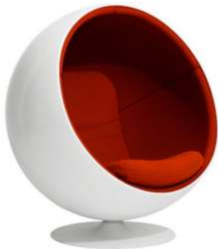
Kuva 27: Eero Aarnion Pallotuoli

Myös Eero Aarnion tuotantoa, kuten Pallotuoli (kuva 27), on päätyntä aikoinaan jäljitelmänä (kuva 28) myyntiin VOGAn verkkosivuille. 280 Esimerkiksi Pallotuolin jäljitelmän tunnistaminen on helppoa heikompi laatusista materiaaleista sekä erityisesti jalan kiinnityksestä. 281 Aarnio on kuitenkin onnistunut saamaan tuotteensa pois VOGAn sivuilta. 282