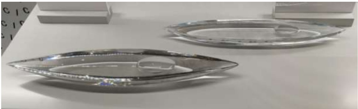
Kuva 1: Designmuseon Keräilijät ja kokoelmat -näyttelyssä esillä olleet lasiveistokset. Vasemmalla aito Sarpanevan Kajakki ja oikealla väärennös Rikosmuseon kokoelmasta. Väärennöksen erottaa selkeästi lasimassan sävy- ja kirkauseroista sekä muodosta ja koosta, kun sen rinnalle asettaa aidon esineen.

Toiminta paljastui 2000-luvun alussa, kun brittiläinen taidekauppias epäili teoksia väärennöksiksi ja otti yhteyttä poliisiin. Teokset todettiin silmämääräisesti väärennöksiksi useamman ammattilaisen toimesta ja lopulta lasille tehty alkuainetutkimus paljasti poikkeuksellisen lasimassan ja vahvisti väärentämisen tapahtuneen. Motiivina väärentämiselle toimi raha, koska Kajakki -veistoksen arvo voi taidemarkkinoilla olla jopa 10 000€. 218 Kyseisen lasiteoksen arvostuksen taustalla on harvinaisuus, sillä teosta on tehty vain tilauksesta ja sen valmistaminen on ollut työläs ja kallis prosessi. Veistoksesta on valmistettu kahta kokoa, 340 mm ja 575 mm pitkiä. 219