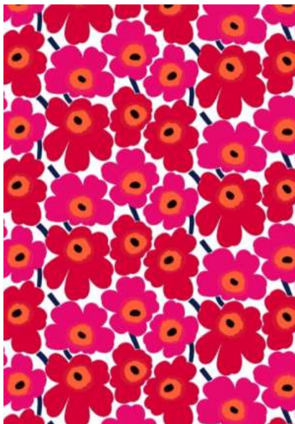
Kuva 47: Marimekon tavaramerkillä suojattu Unikko.

Marimekon Unikko -kuosin on suunnitellut vuonna 1964 Maija Isola vastalauseena Armi Ratialle, joka oli kieltänyt kukkakuvioiden suunnittelun, sillä ne olivat hänestä kauniimpia luonnossa kuin kankaalle painettuna. Isola ei pitänyt siitä, että hänen luovuuttaan pyrittiin rajoittamaan. Kuvio on ollut yhtäjaksoisesti tuotannossa suunnittelustaan lähtien ja siitä on muodostunut Marimekon menestystarina, se on jopa niin tunnettu, että se on kuin Marimekon toinen logo. 302