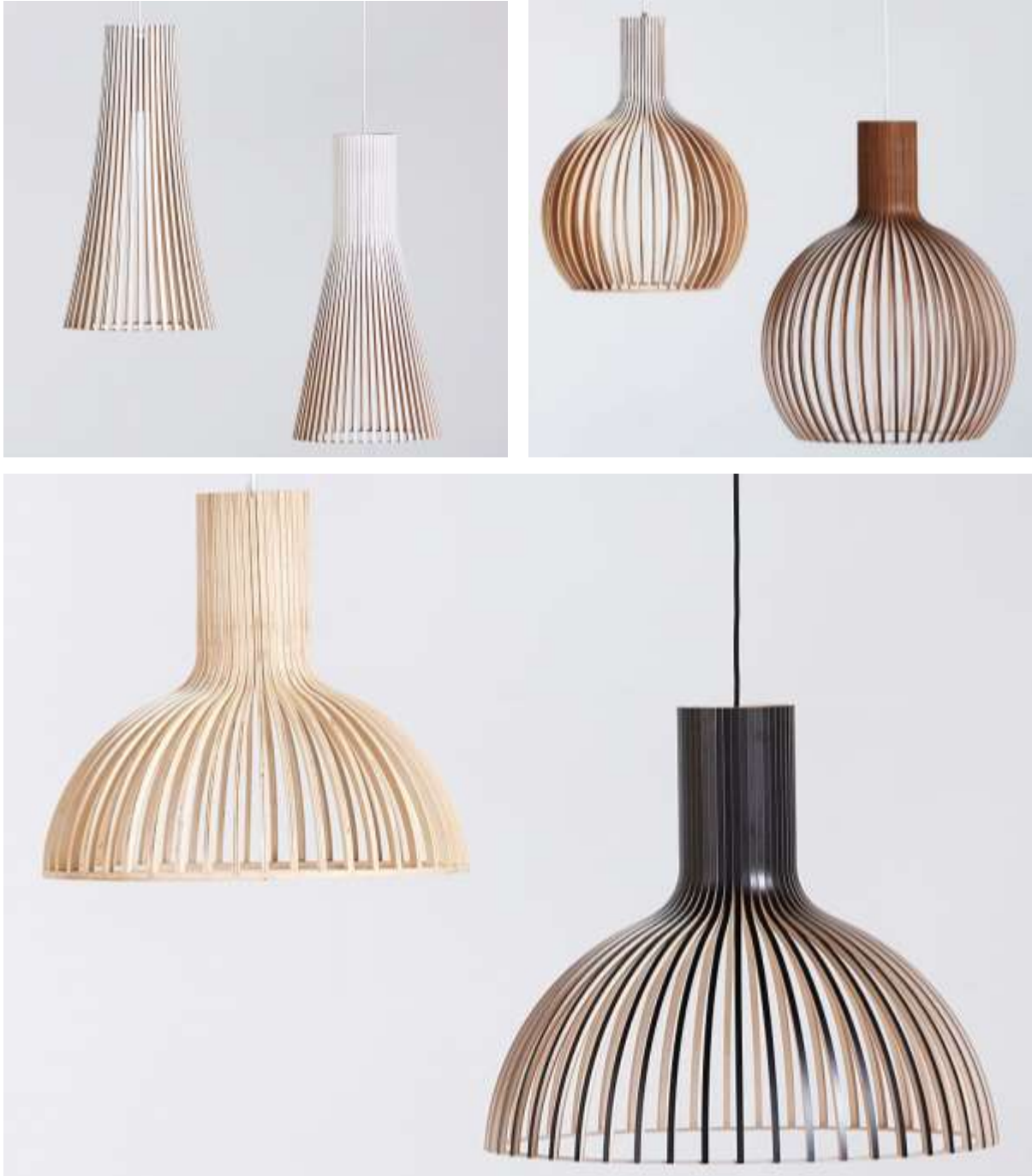
Kuvat 4–6: Kuvissa vasemmanpuoleiset ovat väärennöksiä.

ostavansa aidot Secton valaisimet. Julkisesti laittomia kopioesineitä esillä pitävä syyllistyy kuitenkin rikokseen, joten kopiot ovat riski myös tässä suhteessa. Usein huijarifirmat käyttävät alkuperäistuotteiden kuvia myynti-ilmoituksissaan ja lähettävät asiakkaalle halvan kopion aidon esineen sijaan. Asiakas ei aina välttämättä edes tiedä, että kyseessä on kopio. 222