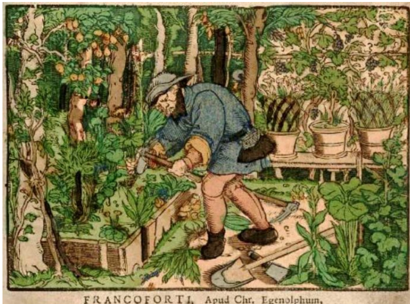
Kuva teoksesta: Herbarum, arborum, fruticum, frumentorum ac leguminum, animalium praeterea terrestrium, volatiliu[m] & aquatiliu[m]

Kirja on jaettu lukuihin, jossa käydään läpi linnojen, kartanoiden ja pappiloiden puutarhoja, yksittäisten kasvien historiaa ja erilaisia käyttötarkoituksia sekä 1700- ja 1800-lukujen kaupunkien pihoista löytyneitä hyöty- ja koristekasviviljelmiä. Esimerkiksi Naantalin birgittalaisluostaripuutarhassa kasvoi 1400-luvun lopulla ahomansikkaa, vadelmaa, hullukaalia ja katajaa; samoin nokkonen, hamppu ja humala kuuluivat kasvivalikoimaan. Teos paljastaa myös, että Suomessakin kokeiltiin riisinviljelyä, mutta kokeilu epäonnistui – tämä tapahtui niin sanotun hyödyn aikakaudella 1760-luvulla, jolloin kasviviljelyyn yhdistyivät valistuksen aatteet ja ajan talouspoliittiset ajatukset kansallisesta omavaraisuudesta. Samaan aikaan paremmin menestynyt peruna alkoi yleistyä suomalaisilla viljelmillä. Suosiota se alkoi saada varsinkin sen jälkeen, kun keksittiin, että perunasta saattoi valmistaa myös viinaa.