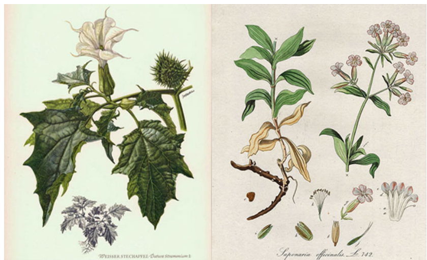
Datura stramonium (hulluruoho) ja Saponaria officinalis (suopayrtti)

Puutarhaviljelyn historiaa koskeva monialainen tutkimus kuitenkin osoittaa, kuinka parhaimmillaan eri tieteenalat voivat täydentää toisiaan. Koska puutarhoja koskevat kirjalliset lähteet ovat usein niukkoja, voi kasviarkeologia kertoa paljonkin siitä, mitä esimerkiksi 1600- ja 1700-lukujen suomalaiskaupungeissa on aikoinaan kasvanut – tieto, joka on ollut ihmisille itsestään selvää jokapäiväisessä arkisessa elämässä, mutta joka sittemmin kirjaamattomana on kadonnut kokonaan.