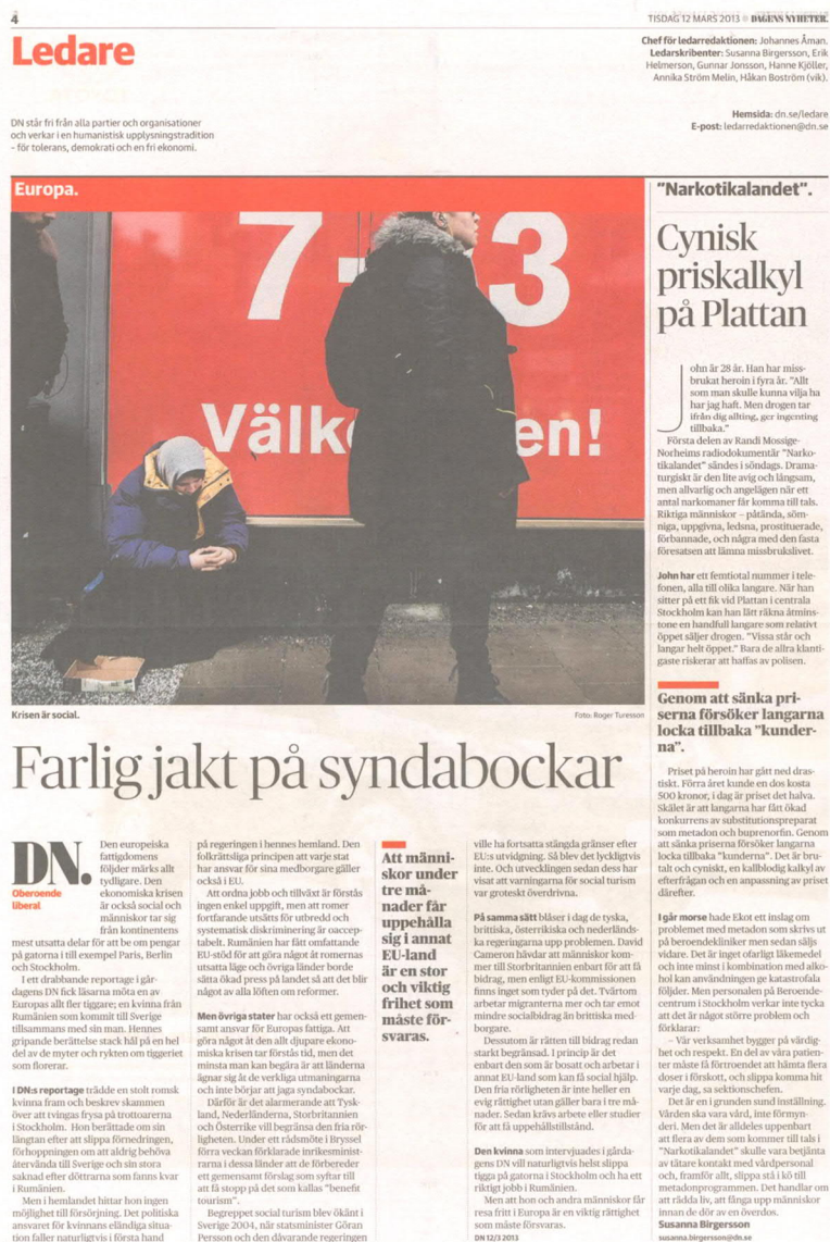
Abb. 1: Ledare auf der Seite 4 der Ausgabe von DN vom 12.03.2013.