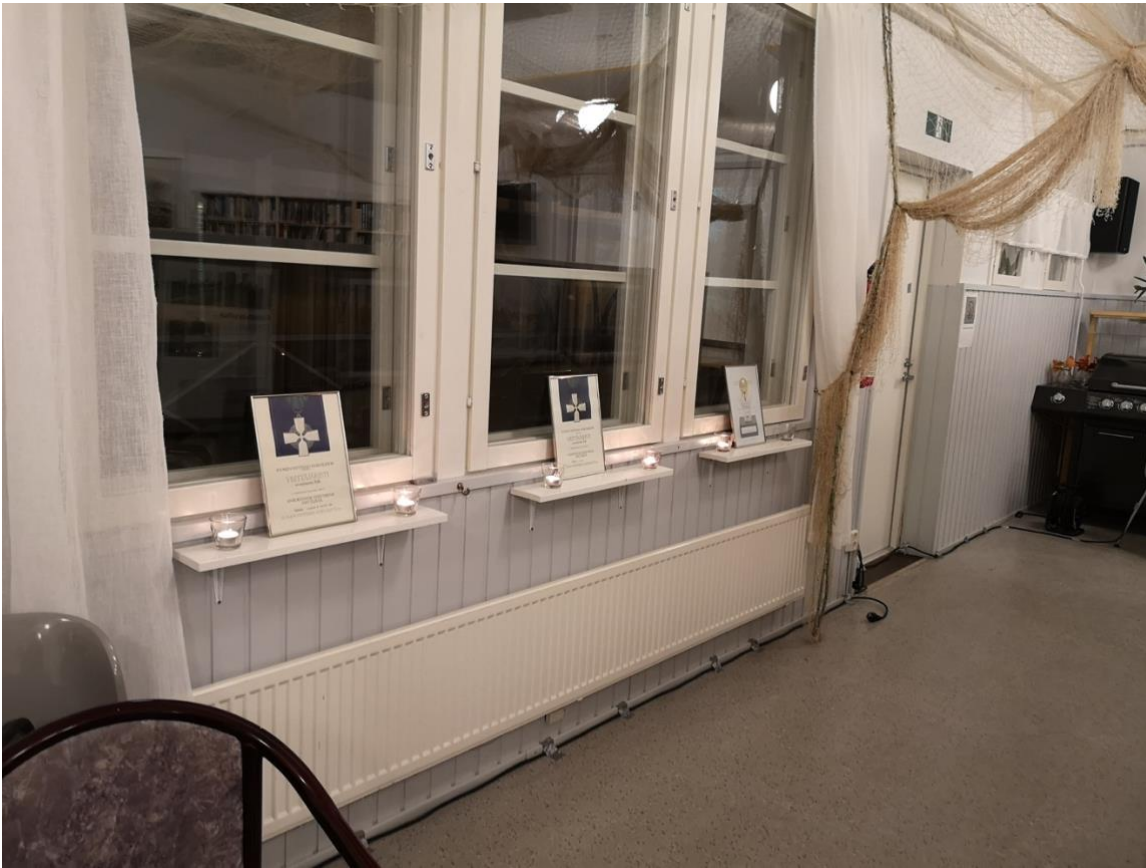
Kuva 2 Kurtin Sahan ansiomerkkejä