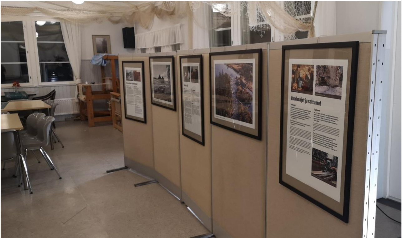
Kuva 4 Näyttelytekstit sijoitettiin sermiin. Ne laitettiin paikoilleen taitellulla rautalangalla.