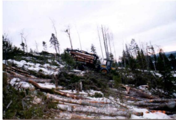
Riekamovaarassa ajokone täydellä kuormalla