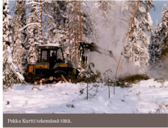
Pekka Kurtti tekemässä töitä.