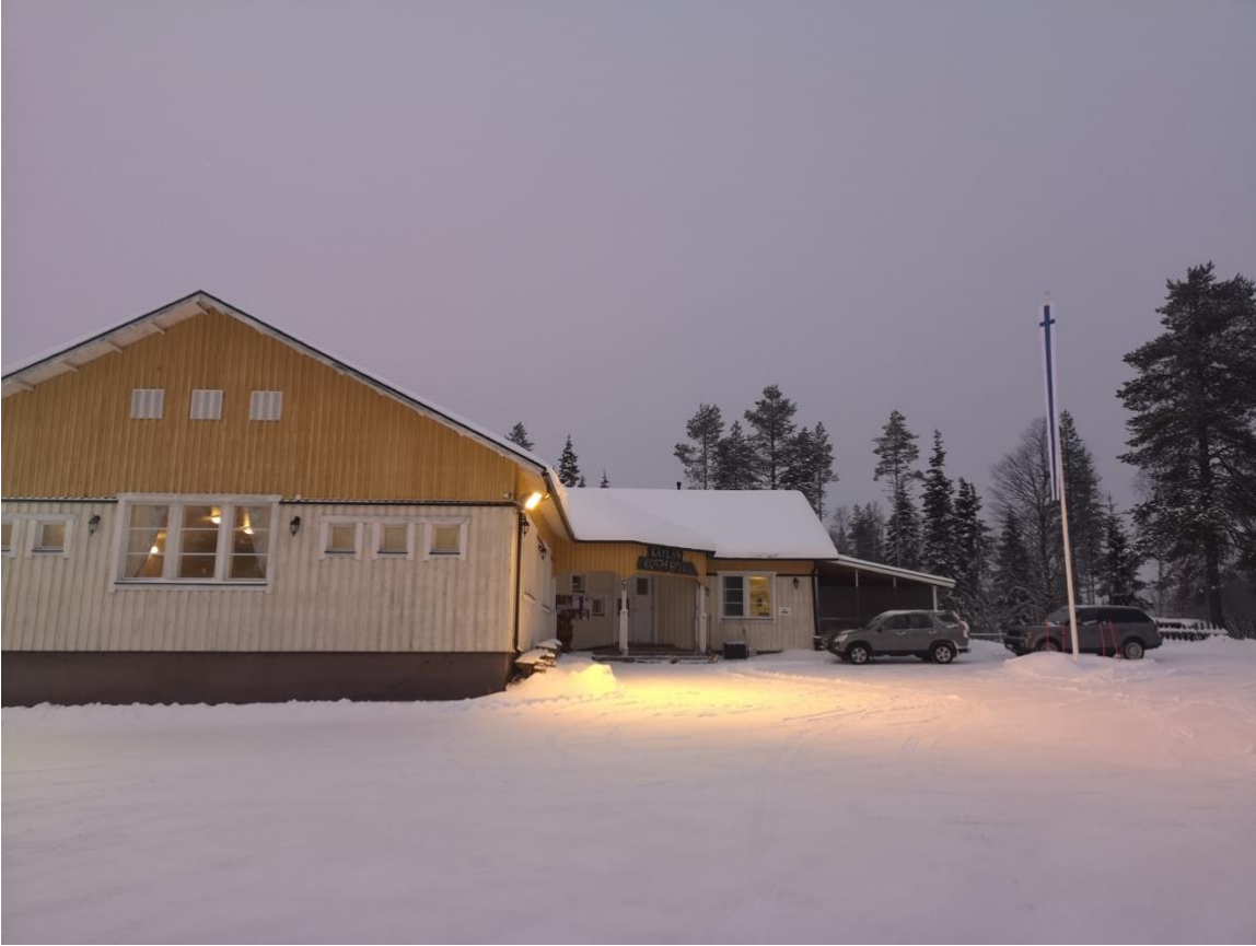
Kuva 1 Korpihovi Näyttelyn sijainti