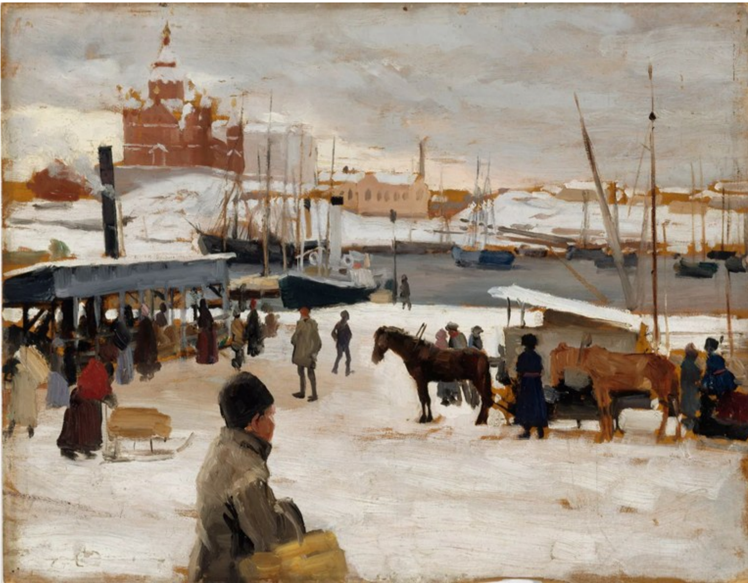
Albert Edelfelt: Talvipäivä Kauppatorilla, harjoitelma, 1889. Omistaja: Suomen valtio. Kokoelma: Rudolf ja Emilie Geselliuksen testamenttikokoelma.

Vaikka konkurssioikeudenkäynti ei ollut päättynyt vapauttavaan tuomioon vaan elinikäiseen konkurssiin, konkurssin tehnyt yrittäjä syrjäytyi täydellisesti varsin harvoin. Tavallisempaa oli se, että konkurssintekijä, usein jopa esimerkiksi puutteellisesta kirjanpidosta rangaistu, löysi pian uuden pestin esimerkiksi kunnallishallinnon tai oikeudenhoidon parista. Monet pienyrittäjät, niin kauppiaat kuin käsityöläiset, palasivat uudelleen entisiin elinkeinotoimiinsa.