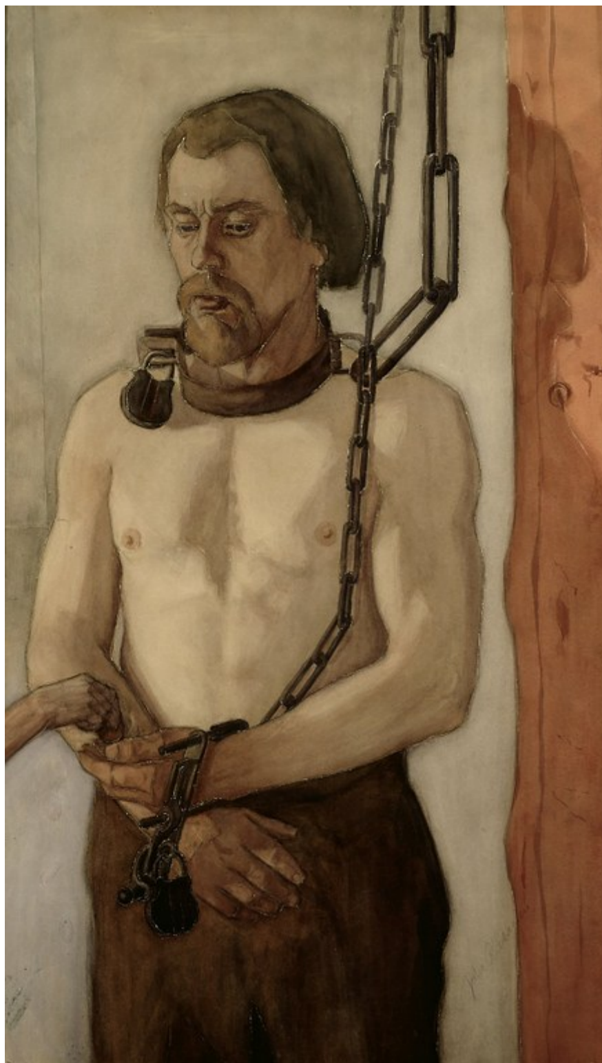
Juho Rissanen: Rauta kaulassa, 1900. Kansallisgalleria, Ateneumin taidemuseo, Antellin kokoelma.

”Hyvät velalliset” piti säästää pahimmilta seurauksilta, joita olivat elinikäinen velkojen takaisinmaksuvastuu, porvareiyhteisöstä erottaminen sekä vankeus vedellä ja leivällä. Tätäkin äärimmäisempi rankaiseminen oli mahdollista. Nykyajan konkurssin tehneet yrittäjät ovat toisinaan kuvailleet oloaan julkisessa häpeäpaalussa olemiseksi, mutta esiteollisena aikana häpeäpaalu saattoi odottaa velallista konkreettisesti. Tämä koski tosin ainoastaan petollisuudesta tuomittuja konkurssivelallisia.