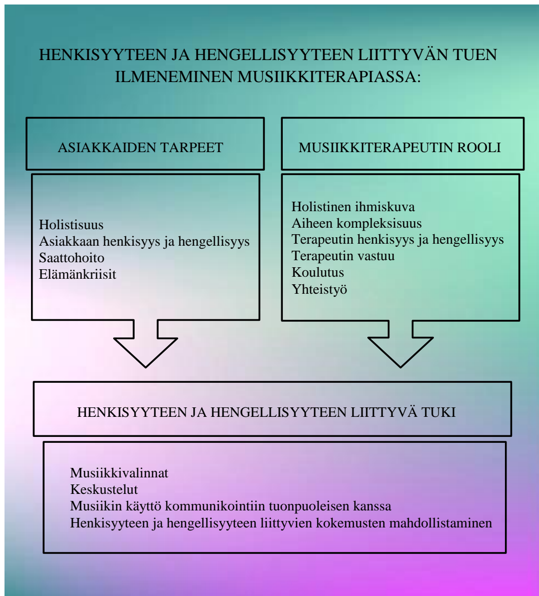
Kuvio 2. Henkisyyteen ja hengellisyyteen liittyvä tuki musiikkiterapiassa.

Musiikkiterapeutin taidot ratkaisevat, saako asiakas tarvitsemaansa henkisyyteen tai hengellisyyteen liittyvää tukea vai ei. Kun musiikkiterapiassa halutaan vastata asiakkaan henkisyyteen tai hengellisyyteen liittyviin tarpeisiin, on tärkeää osata käyttää musiikkia taitavasti. Musiikkiterapeutti luo omalla taidollaan ne olosuhteet, jotka mahdollistavat henkisyyteen tai hengellisyyteen liittyvän kohtaamisen. (Moss, 2019, 13.)