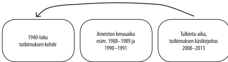
Kuvio 1: Tutkimuksen aikatasot.

– ja katseeseemme vaikuttavat omat käsityksemme ja esitietomme tutkittavasta aiheesta ja ajasta. 272 Kaksitasoisten aikakerrosten hahmottaminen ei kuitenkaan riitä, sillä aineiston keruuajankohta muodostaa tutkimukseeni kolmannen, tarkentavan aikatason. 273 Kuvio 1 havainnollistaa aikakerroستumia ja katseen suuntaa.