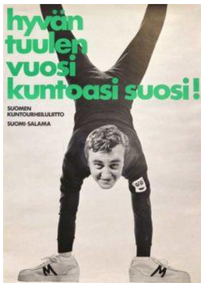
SKUL:n kuntoliikuntajuliste, Urheilumuseo.