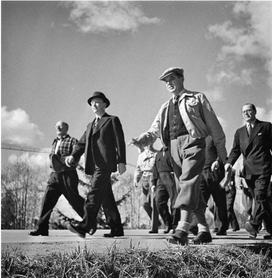
Risto Ryti ja Jukka Rangell maaottelumarssilla Helsingissä 1941

Väitöskirjan ensimmäinen osa tutkii kuntoliikunnan edistämistä järjestöjen näkökulmasta aikavälillä 1941–2010, asiakirjalähteistöä käyttäen. Tutkimus alkaa vuoden 1941 legendaarisesta maaottelumarssista, mutta tarkastelun pääpainopiste on kuitenkin toisen maailmansodan jälkeisessä ajassa.