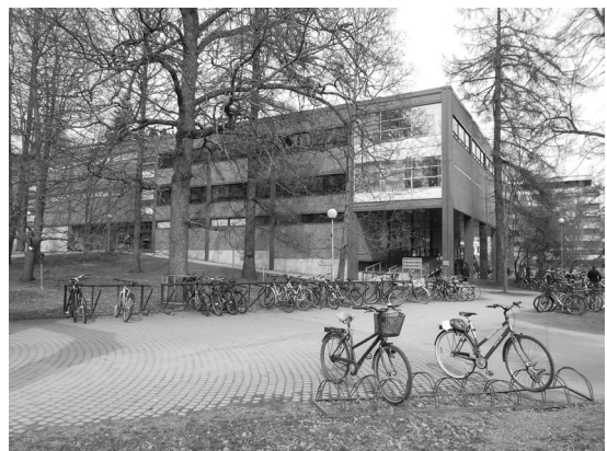
Kuva 6. Pitkä työura sai hiljattain eläkkeelle jääneen Annelin pitämään Jyväskylän yliopiston kirjastoa elinympäristönsä tärkeimpänä paikkana.

Leena valitsi tärkeäksi paikakseen Jyväskylän keskustassa sijaitsevan Harjun (kuva 7), joka tunnetaan kaupunkilaisten keskuudessa suosittuna ulkoilu- ja puistoalueena. Harju on myös yksi Jyväskylän merkittävimmistä tunnuspiirteistä, jonka rinnettä nousevat Neron portaat, laella seisova Vesilinna sekä kupeeseen rakennettu urheilukenttä muodostavat kanonisoituneessa Jyväskylä-kuvastossa paljon