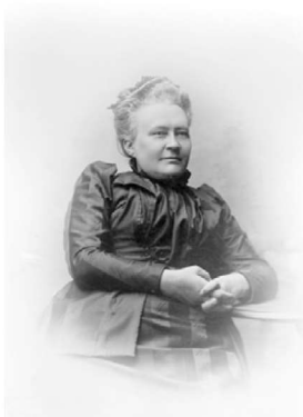
Minna Canth.