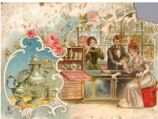
Kultasepäänliikkeen liikekortti.

1904) ja osuuskassojen OKO (perustettu 1902). Osuustoiminnan ohella syntyi myös osuustoiminnallinen Pellervo-ryhmä. 161