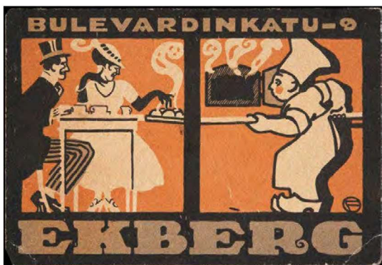
Cafe Ekbertin liikekortti vuodelta 1917.

Ensimmäinen jakso kuvaa aikaa ennen elinkeinovapautta, jolloin luotiin perusta suomalaiselle yrittäjyydelle. Toisena jaksona voidaan pitää suomalaisen yrittäjäkunnan ja yrittäjätoiminnan laajentumisen vaihetta (noin 1860–1939). Suuret uudistukset, kuten rautatielaitoksen rakentaminen ja pankkilaitos, vaikuttivat liiketoiminnan kehittymiseen. Maailmansotien välisenä aikana Suomi itsenäistyi ja maa alkoi demokratisoitua. Ulkomaankauppa laajeni merkittävästi. Kolmas vaihe (noin 1944–1959) kuvaa toisen maailmansodan jälkeistä jälleenrakennuksen Suomea, jolloin teollistuminen pääsi vauhtiin ja rakennustoiminta lisääntyi. Neljäs vaihe (noin 1960–1990) kuvaa aikaa, jolloin Suomi muuttui kiihtyvällä vauhdilla agraariyhteiskunnasta teollisuusyhteiskunnaksi ja jolloin globaali kapitalismi alkoi yleistyä ja korkean teknologian käyttö lisääntyi. Elintason nousu näkyi lisääntyneenä kulutuksena. Kotimainen kysyntä kasvatti pk-sektoria ja vauhditti talouden yleistä kehitystä. Viidettä vaihetta voi