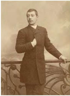
Karl Fazer.

Karl Fazer syntyi Helsingissä vuonna 1866. Hänen isänsä oli sveitsiläissyntyinen turkkuri Eduard Fazer, joka oli muuttanut Suomeen vuonna 1844. Karl Fazer opiskeli konditoria-alaa Pietarissa, Pariisissa ja Berliinissä. Hän perusti Helsinkiin syksyllä 1891 kahvilan, jonka yhteydessä oli leipomomyymälä. Perheyritys laajeni pian makeisten tehdasmaiseen tuotantoon. Fazerin kahvila- ja konditoriatoiminta oli suosittua, ja yritys avasi lisää kahviloita myös muualle kuin ydinkeskustaan. Makeisista tuli kuitenkin yrityksen pääala.