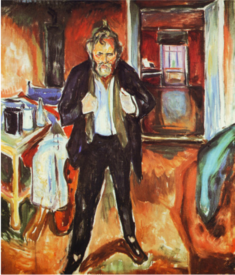
Kuva 10. Edvard Munch, Omakuva sisäisessä kaaoksessa , 1920.

Viime vuosikymmeninä on pohdittu mahdollisuutta, että Munch olisi kirjoitustensa, valokuviansa ja omakuviansa kautta luonut itsestään tietynlaisia taiteilijakuva, jossa korostuvat elämän varhaisten tragedioiden vaikutus taiteelliseen luovuuteen, aistimiseen ja tuntemiseen liittyvä yliherkkyys ja sosiaalinen vetäytyminen, jotka usein punoutuvat keskusteluun taiteellisesta originaa-