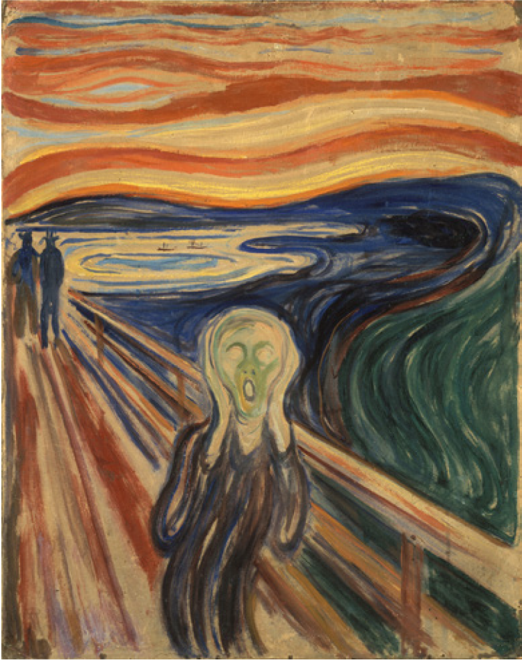
Kuva 5. Edvard Munch, Huuto , 1910?

Keskeisin ero on, että myöhäisemmässä maalauksessa sillalla seisovalla ihmishahmolla ei ole pupilleja, mikä aikaansaa voimakkaamman vaikutelman sisäisestä kokemuksesta. Varhaisemmassa teoksessa hahmo näyttää ikään kuin katsovan sillalla edessään ole-