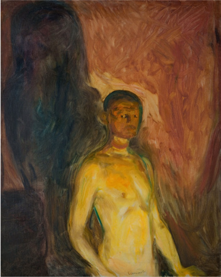
Kuva 7. Edvard Munch, Omakeuva helvetissä , 1903.