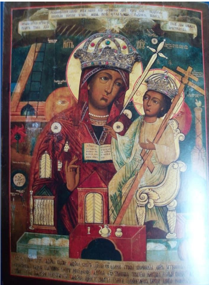
6. Jumalanäidin Akatistos