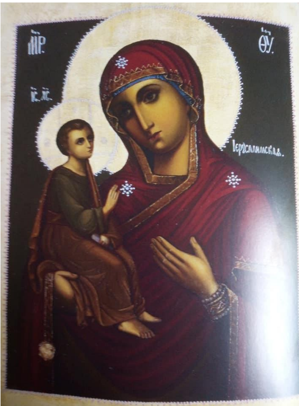
4. Jerusalemin Jumalanäiti