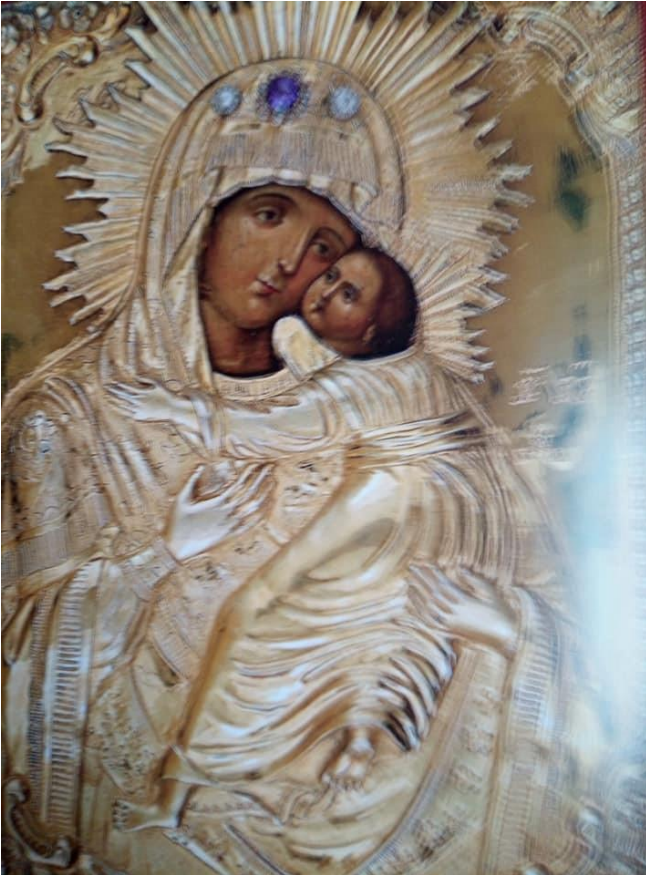
3. Suloisesti suuteleva Jumalanäiti