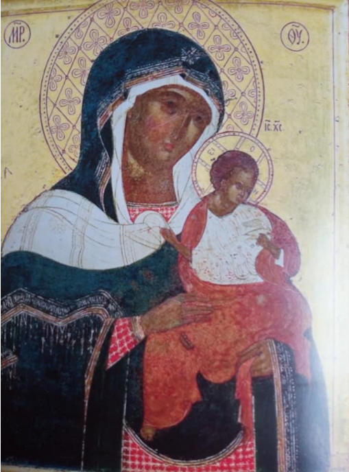
1. Konevitsan Jumalanäiti