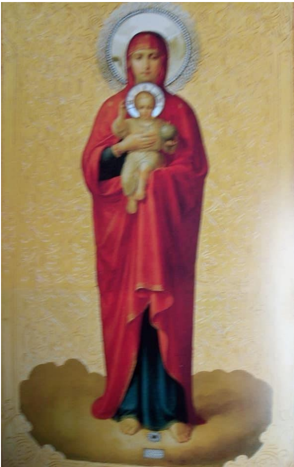
2. Valamon Jumalanäiti