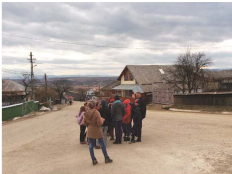
4. kép. Indulás a falu bemutatására