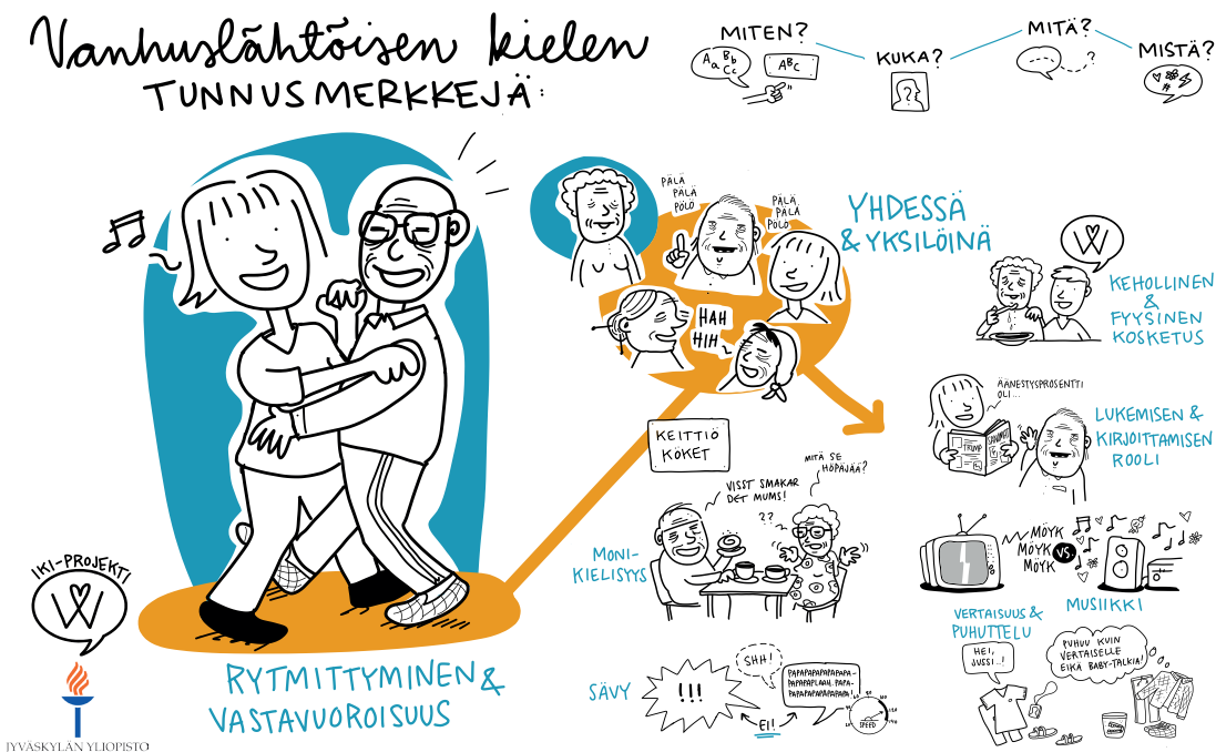
Kuva 2. Vanhuslähtöisen kielen tunnusmerkit.

lailla säädelty institutionaalinen paikka, joka on asukkaille koti ja hoitajille ja esimiehille työpaikka. Jo nämä toisistaan selvästi poikkeavat positiot luovat erilaiset tarpeet ja toiveet vuorovaikutukselle ja kielenkäytölle: siinä missä hoitajat pyrkivät tekemään työnsä tarkoituksenmukaisesti ja sujuvoittamaan hoitoarkea, asukkaat kaipaavat keskustelua, rupattelua ja yhteistä toimintaa hoivakodin arkeen. Hoitajien kielikäsitöksissä korostuvat puheen ymmärrettävyys ja selkeys, asukkailla taas kielen sosiaalinen sidoksisuus, keskustelu ja kuunteleminen. Tutkimuksen perusteella voikin sanoa, että sekä hoitajien, esimiesten että asukkaiden kielikäsitukset perustuvat samansuuntaisiin funktionaalsiin kieli-ideologioihin, mutta hieman eri tavoin. Hoitajien ja esimiesten käsitykset kielestä implikoivat ja indeksoivat selvemmin välineellistä kieli-ideologiaa, jossa kielen arvo ja merkitys määrittäytyi instituution ja toimijoiden tehtävistä