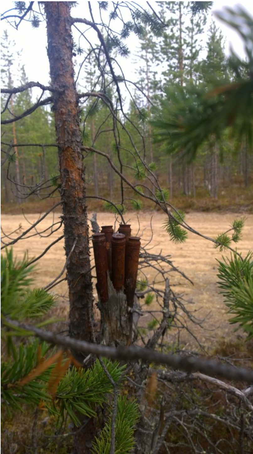
Rovaniemi 2015.