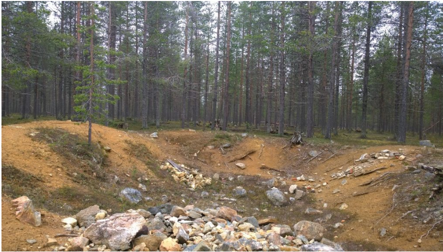
Taivalselän tykkipatteri Vuotsossa 2016.

Kun haastattelimme museoiden ja metsähallituksen työntekijöitä, sotahistoriaharrastajia ja kulttuuriperintöaktivisteja, kohtasimme monenlaisia näkökulmia Lapin sotahistoriaan ja kulttuuriperintöön. Hahmotimme muistin politiikan dynamiikkaa, johon liittyy niin paikallinen kuin kansallinen ulottuvuus.