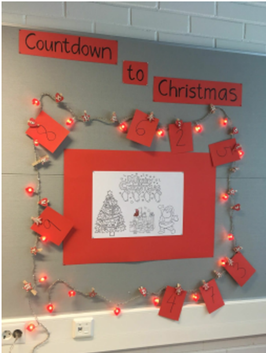
Kuva 3.

Jokaisella oppilaalla on myös omassa vihkossaan sama kuva kuin seinällä. Värityskuva voi olla myös numeroitu, jolloin joka päivä väritetään yksi osa kuvasta.