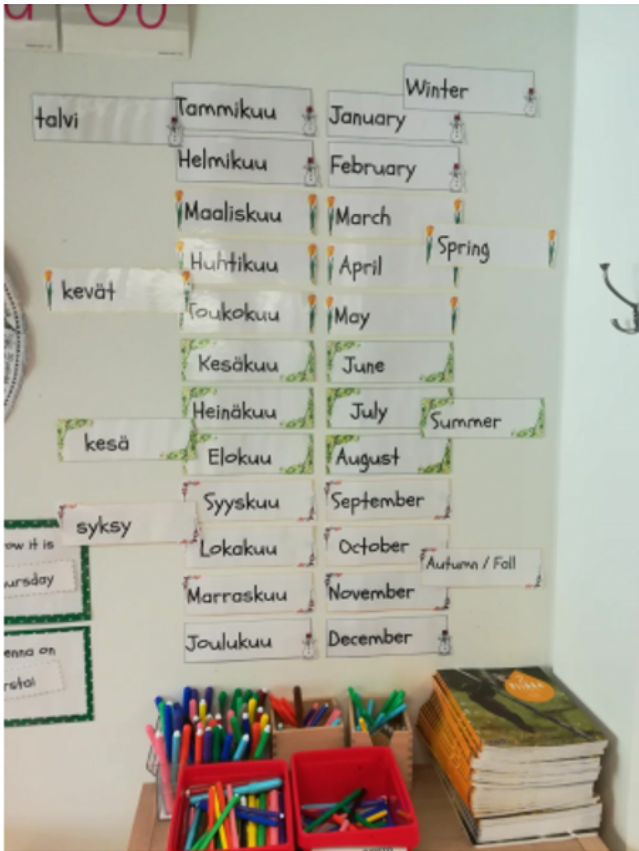
Kuva 2.

Yksinkertainen kalenteri esittää toisaalta kuukaudet kahdella kielellä, toisaalta sen, miten osa kuukausista saattaa kuulua eri vuodenaikaan eri puolella maailmaa.